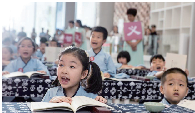
加强教育,打好发展之基