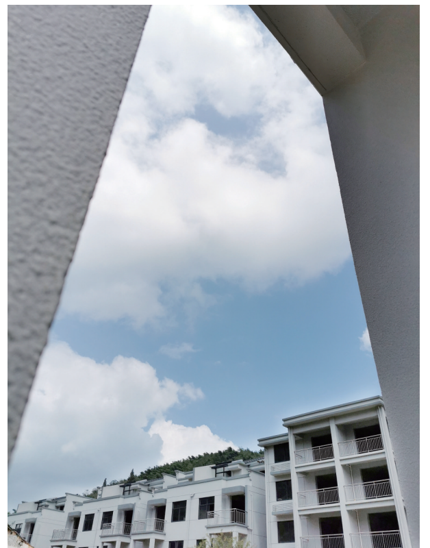
大堰镇杜家畈村农房改造圆了山村“别墅梦”