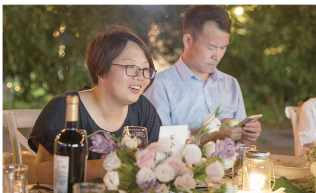
尚田街道有批活跃在助农致富的青年人