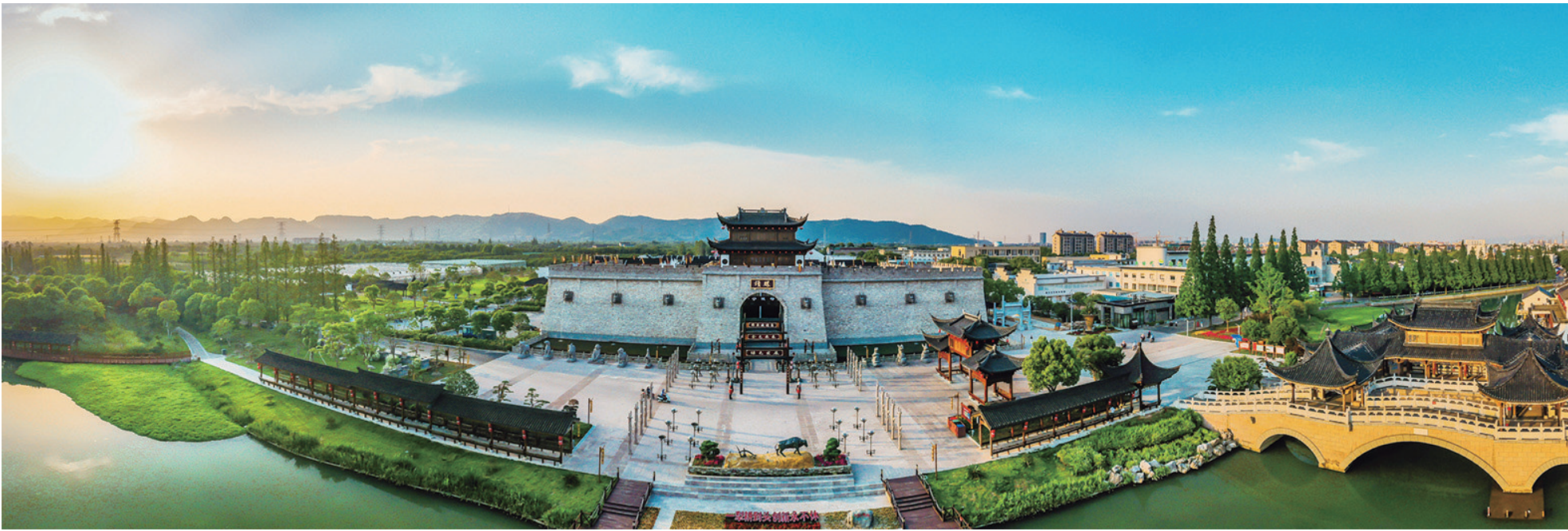
令人羡慕的滕头新农村