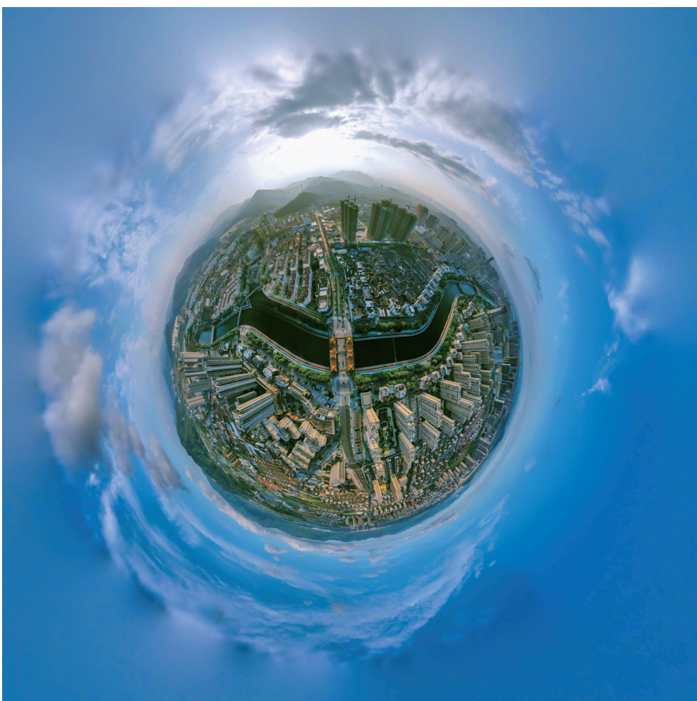
鸟瞰奉城新家园