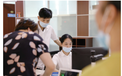
“最多跑一次”惠民多