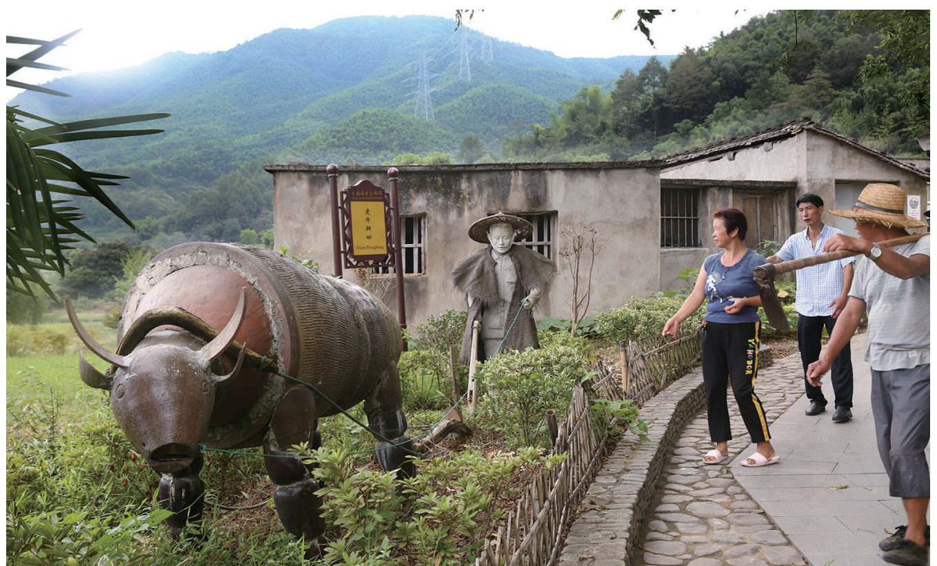
大堰镇后畈村打造缸瓦艺术生态村助民奔小康