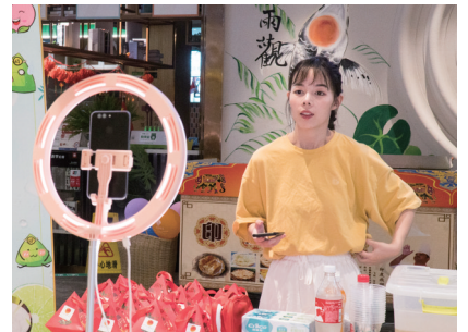
美女直播成时尚