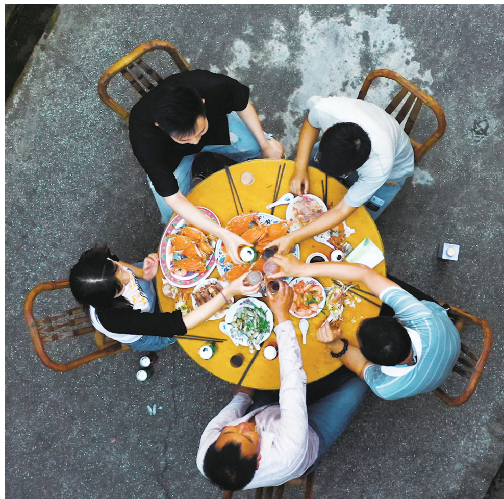
裘村镇应家棚村,一家人围坐在一起吃着海鲜,幸福满满