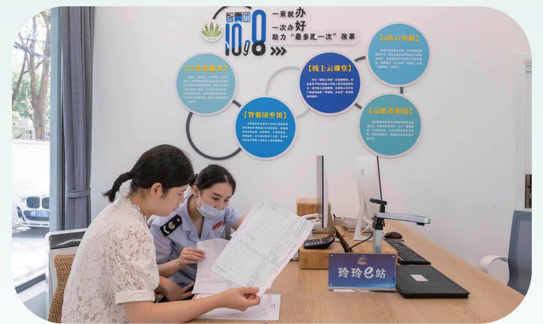
1098智慧团辅导纳税人办理业务

化,助力宁波打造“无证件城市”。远程云辅导,架起云桥梁。积极拓展“非接触式”办税服务范围,配置投屏大电视,针对共性“疑难杂症”,由税务干部开展“一对多”专项讲解,实现辅导“多人共享”。通过云课堂、短视频、预约办税,远程辅导等方式加力落实税收优惠政策,为纳税人定制干货满满的税务宝典。