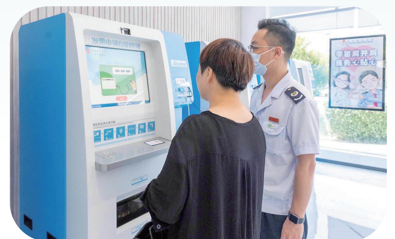
税务干部引导纳税人自助办理发票申领业务

“零窗”智慧办税厅还被列为宁波市建设长三角区域一体化智慧税务首个试点单位,将进一步加强跨地域、跨部门合作,利用税企征纳沟通平台,开启智慧辅导,助力办税“零次跑”。“目前,‘零窗’智慧办税厅是在办税理念和模式上一次方向性尝试和探索,实现了‘税务人+纳税人、线上办+线下办,智慧办+人工办,办税事+税宣辅导’四方面的高度融合。下阶段,将进一步完善大厅服务管理制度,丰富服务形式,提升专业管理水平和精准辅导能力,确保纳税人的获得感和满意度提速腾飞。”宁波市税务局党委书记、局长梅昌新表示。