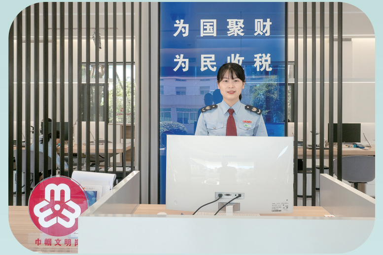
全功能“零窗”智慧办税厅导税台

干部由“坐在窗口等”转变为“上前一步迎”,主动服务意识更强。开发“体检报告”,减税红利一目了然。结合“减税降费金卫士”一户一档功能,开发更为全面实用的“税务体检报告”。纳税人可通过AI机器人扫码获取基础信息、纳税信用等级、核心办税数据,以及减税降费相关提醒信息,实时查询,确保政策红利“应享尽享”。