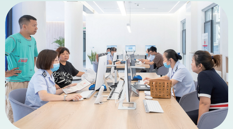
涉税业务一对一辅导

办税演示,确保所有业务一学就会,办得舒心,并积极引导纳税人选择网上办、掌上办、在家办,实现下次不跑。授业解惑,智慧团队解锁桎梏难题。成立1098智慧团,构筑多层次的咨询体系,发挥“大脑”功能,提供“专家门诊”式的答疑服务,邀请资深会计师入驻智慧团,针对性地解决实操难题,专业高效,确保所有业务都能办理、所有疑惑都能解答。