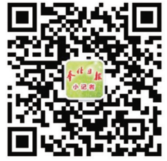
奉化日报小记者 官方微信公众号

据悉,2021年度本报小记者招募工作正在火热进行中。成为一名奉化日报小记者,为家庭减支,享受前所未有的折扣力度,给孩子一个成长、发展的机会。望广大家长继续大力支持孩子加入到小记者大家庭中。填写完报名表,您可通过班主任老师给孩子报名。了解具体招募信息,可扫码关注奉化日报小记者微信公众号,或拨打小记者工作室电话88989537。