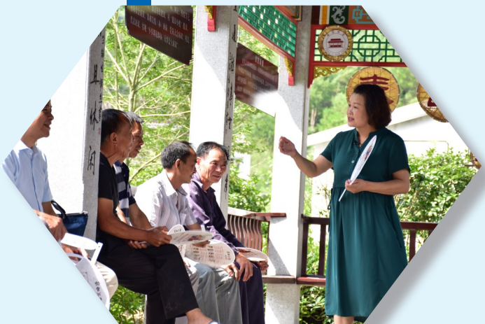
“奉邑学堂走进乡间”走进大堰镇箭岭村