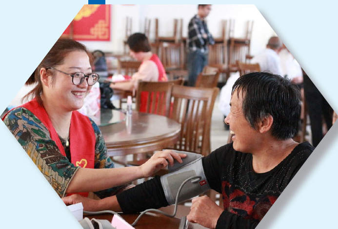
通过线上“点单”,尚田街道梅岭村村民在家门口得到精准服务