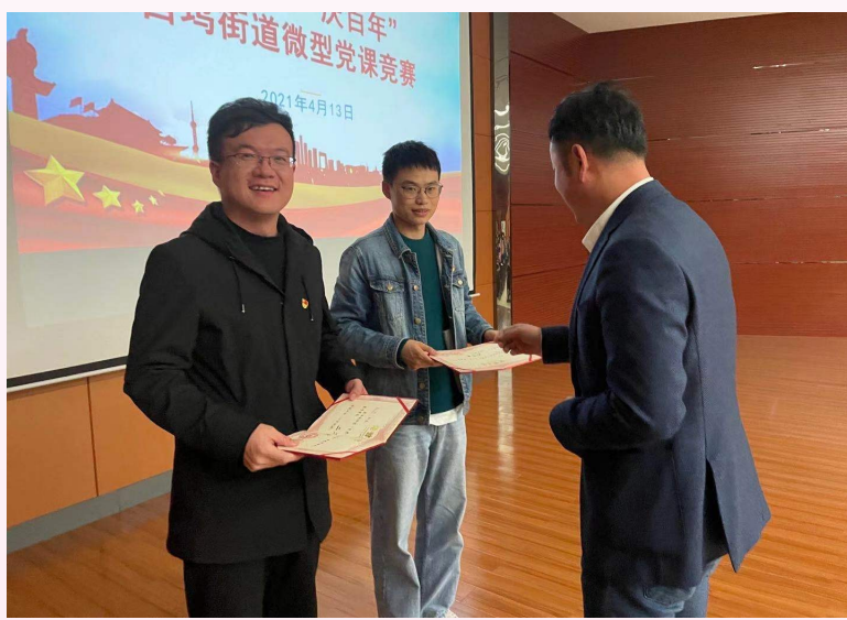
体党员干部特别是青年干部从党史中汲取干事力量,坚定信念、积蓄力量,务实重干,凝聚起西坞都市水乡村镇高质量发展的强大合力。