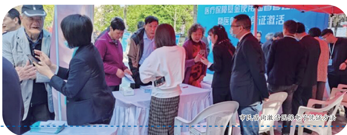
市民咨询激活医保电子凭证方法