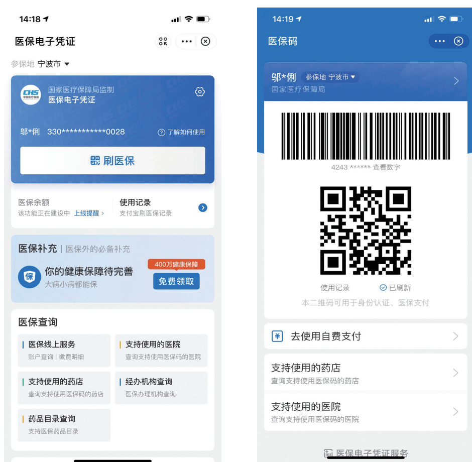
使用出示医保电子凭证样式