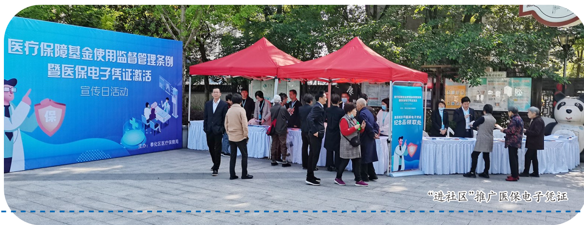
“进社区”推广医保电子凭证