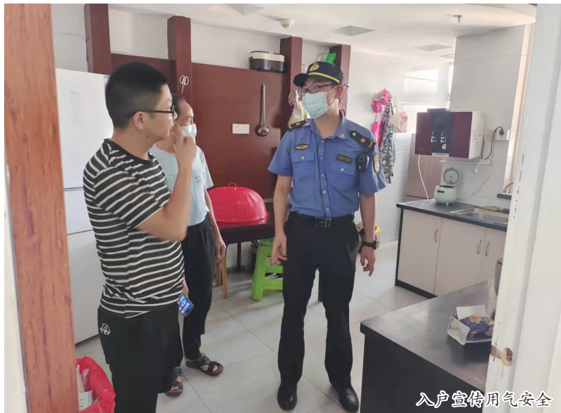
入户宣传用气安全