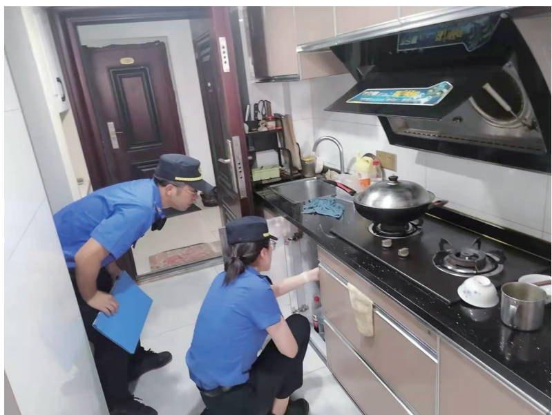
检查高层建筑燃气安全隐患

推进警报系统智能监测。由电信公司提供技术支持,在全季酒店两部电梯的轿厢内各安装了一个智能摄像头。电梯自动监控识别系统与电梯门控制系统相连接,若有燃气瓶和电动自行车进入电梯轿厢就会被智能摄像头自动识别,电梯会发出警报声,且电梯门将无法关闭,确保瓶装燃气无法进梯上楼。