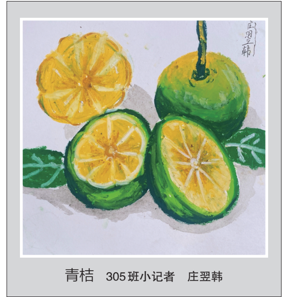
青桔 305班小记者 庄翌韩