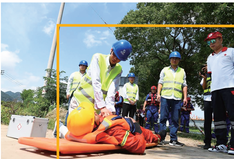
交通项目溺水救援应急演练