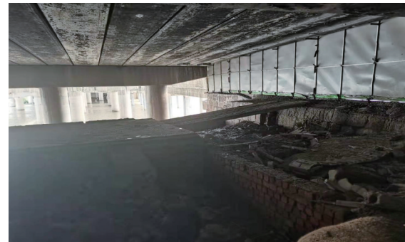
江口立交桥清理后