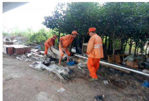
银凤大桥清理行动