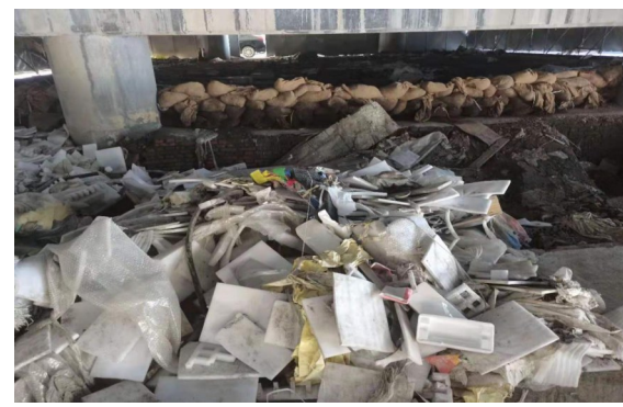
江口立交桥清理前