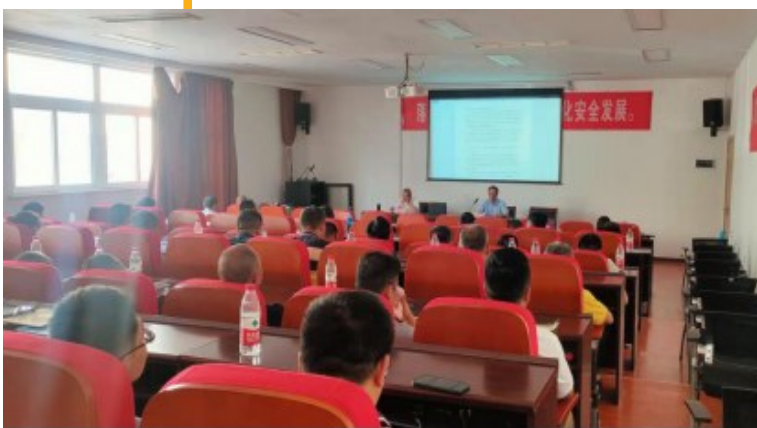
交通工程标准化建设交流会议

根据《全区交通运输系统安全生产专项整治三年行动方案》要求,区交通运输局加大检查频率和力度,督促参建单位开展项目风险评估,编制风险源清单并落实公示制度,完善隐患排查和整改措施两个清单,遏制安全生产责任事故。截至目前,该局共对全区在建工程开展各类专项检查、日常监督检查228次,出动459人次。同时通过综合运用差异化管理、信用评价等手段,强化工程参建各方安全生产责任落实,加强安全生产专项费用使用管理,保障措施完善。