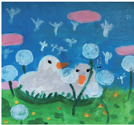
戏水图 居敬小学105班小记者 王若瞳