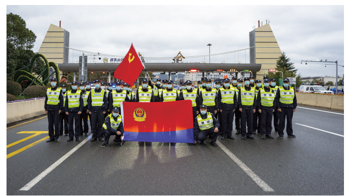
队伍形象优化提升