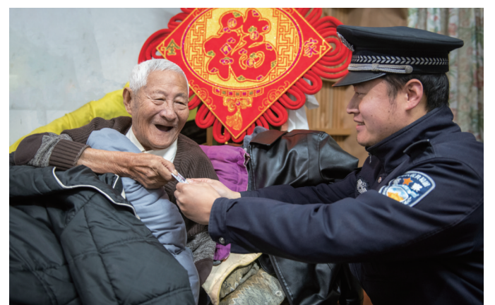
公安改革纵深推进