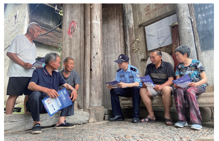
护航发展更加主动