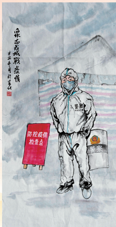
众志成城战疫情 郭赵泓/画