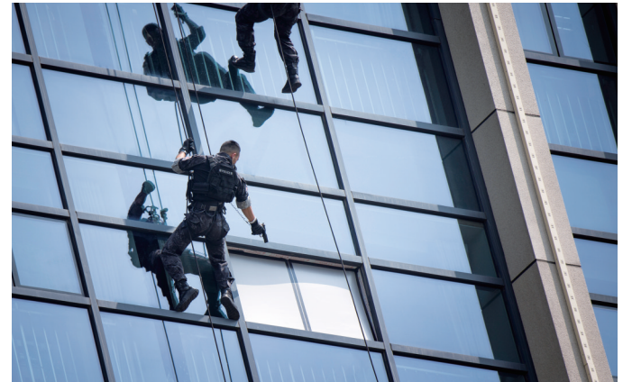
治安环境持续向好

们的脚步”主题党日活动,推动党史学习教育持续升温,局党委获评全省“学习强国”学习之星先进组织。深入开展“青春警色·你我代言”“一颗红心永向党”主题宣传,抓实实战练兵,队伍精气神、战斗力进一步提升。广大民警不忘初心、忠诚履职、无私奉献,涌现了一批先进典型,共有20个集体、300余名个人被各级表彰奖励。