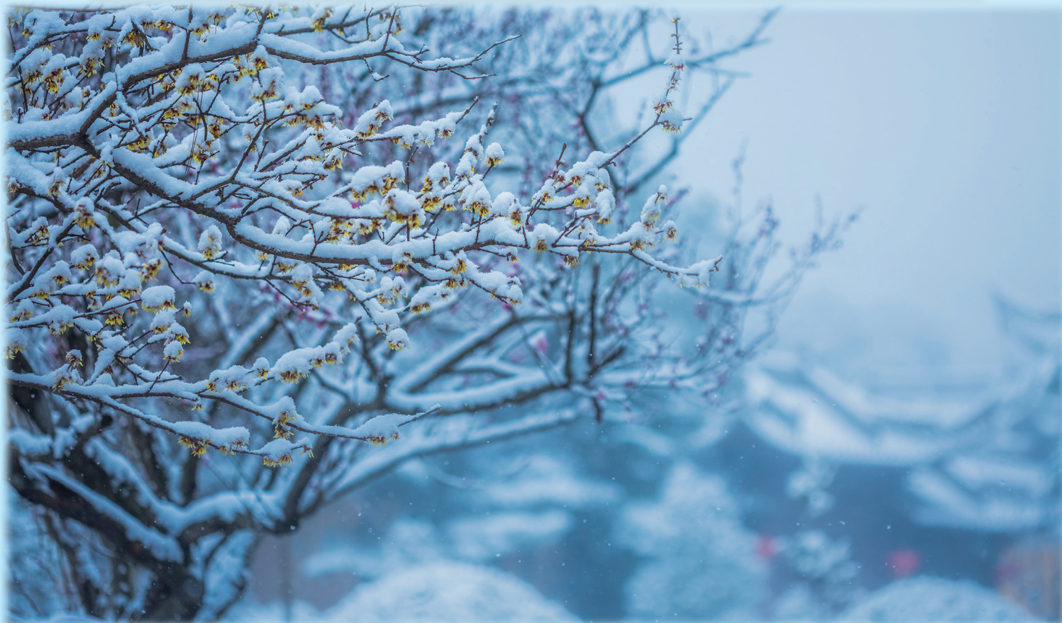
雪却输梅一段香