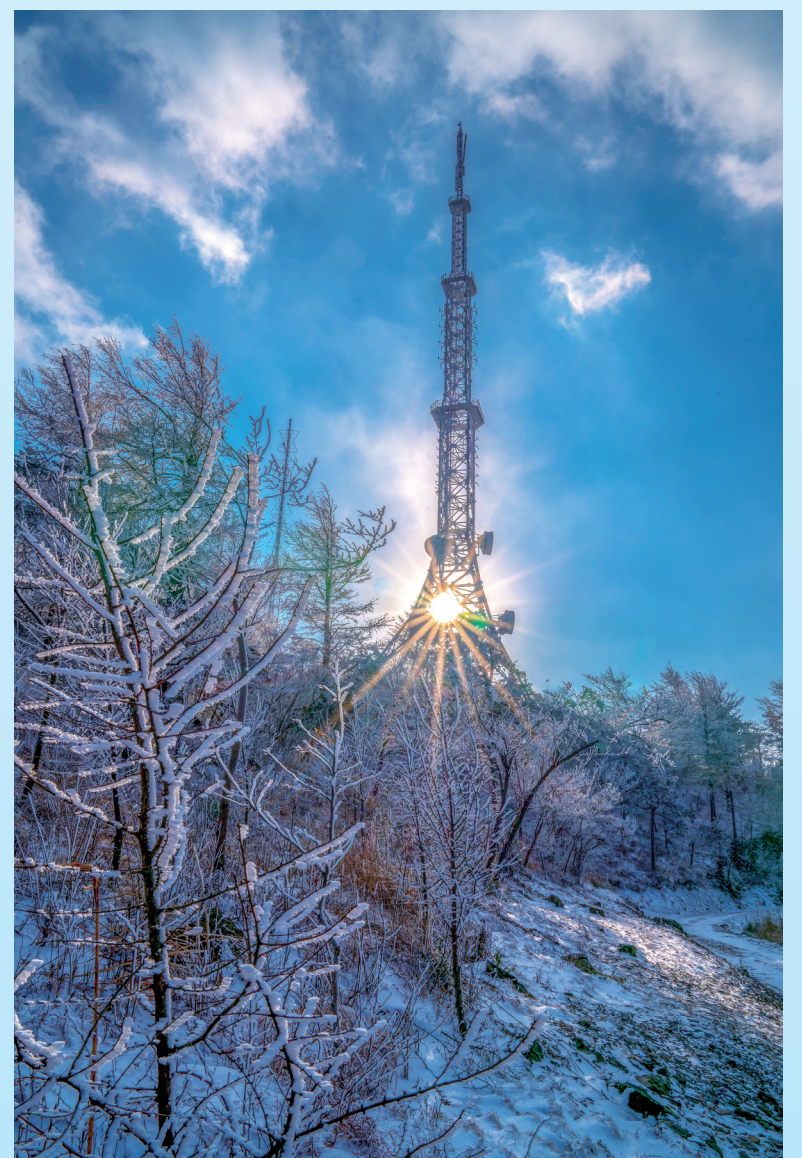
骤雪初霁