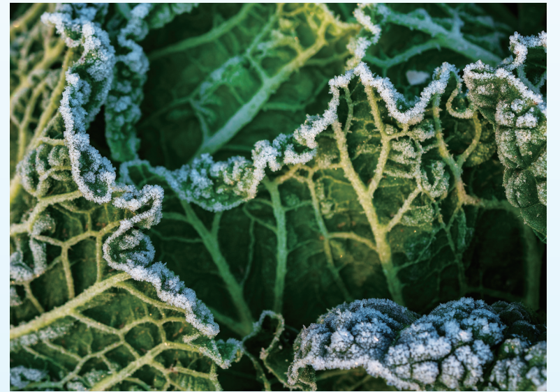
银边翡翠