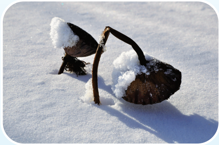
残荷霜似银

岁末年初,奉化在不长的时间内迎来了两场雪。虽然,这雪下得“小气”,但下雪对南方人来说是一件非常快乐的事。