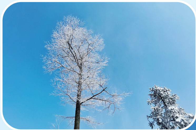
树上裹银装