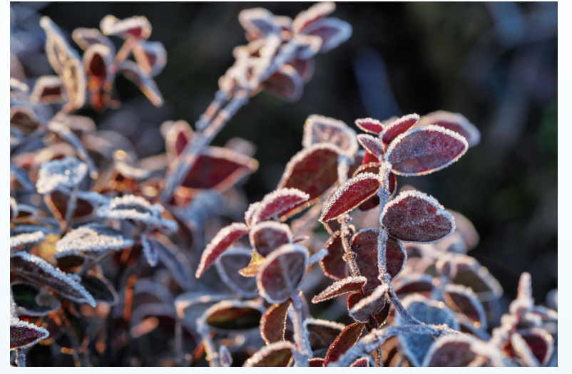
水晶世界