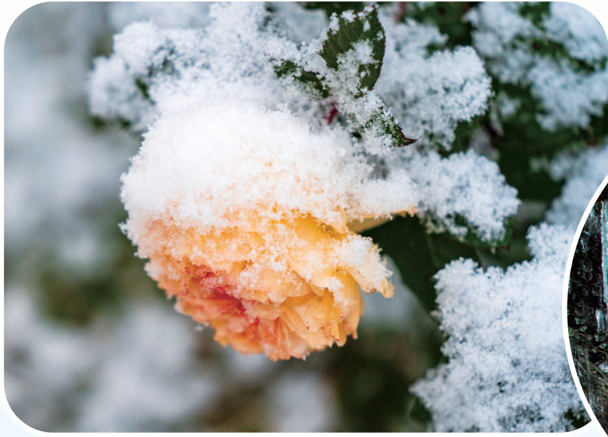
◀粉妆玉砌