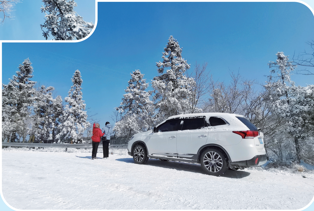
雪景美如画