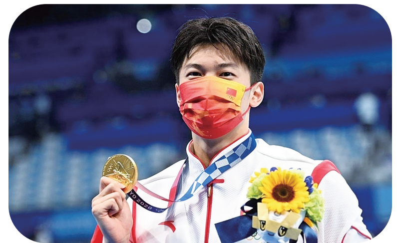
奉籍运动员汪顺勇夺东京奥运金牌,并在全运会上大放光彩

动。推出5条“不忘初心 牢记使命”奉化红色旅游精品线路,策划“红色征程”“奉起之路”红色旅游主题教育线路,在甬派等新媒体开展视频宣传和图文直播,拓宽红色旅游团建和自驾游渠道,吸引游客打卡红色旅游点,充分展示奉化在中国革命、建设和改革历史进程中取得的重大成就。