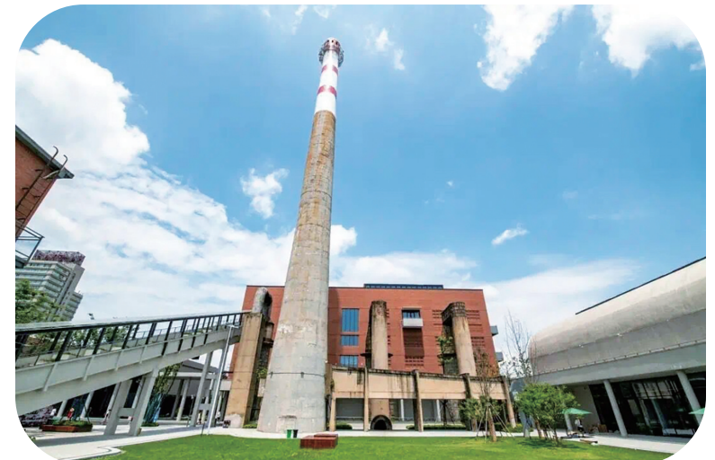
博物馆景区加入国家AAAA级旅游景区行列

“文化基因解码工程”稳步推进。梳理全区文化元素清单,完成20个重点文化元素的基因解码和400个文化元素的图像资料数据输入,纳入全省文化基因库。启动奉化文化标识建设,弥勒文化被确定为首批“浙江文化标识”培育项目。