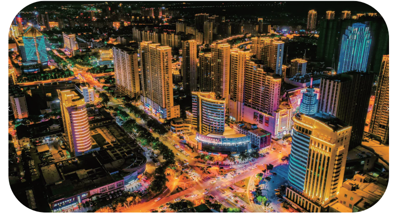
奉化被评为浙江省AAAA级景区区域

进基层、送戏下乡、文化走亲、全民阅读等惠民活动780余场;推进“一人一艺”全民艺术普及工程,举办展览、讲座和培训课程100余场次,受益群众超5000人次;以非遗馆为阵地,全年举办农民画、植物染、浆纸等体验活动90余场。2021年共培训三级社会体育指导员225名,至2021年底,我区共有注册社会体育指导员1777人,每千人拥有社会体育指导员3.07人。