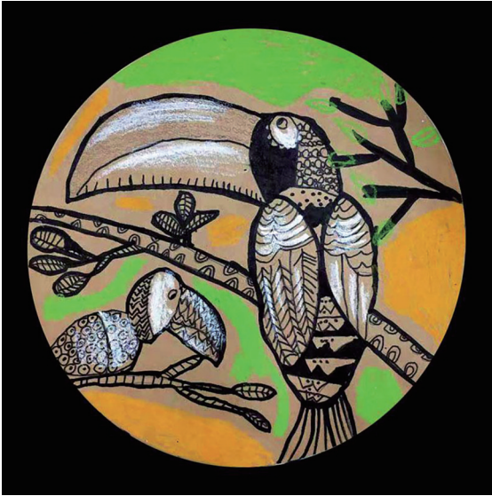
鸟 居敬小学406班小记者 竺传哲