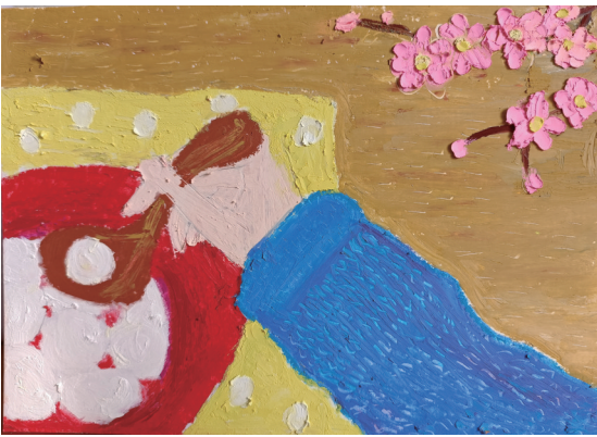
吃汤圆 居敬小学506班小记者 卓宏伊伽