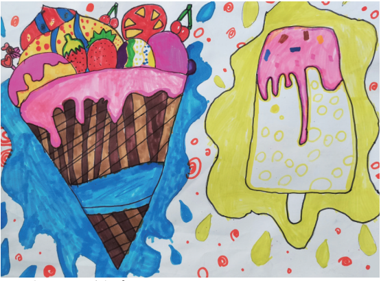
舌尖上的美食 居敬小学108班小记者 王梓璋