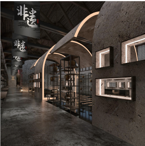
“西坞粮仓”非遗文化体验与展示区效果图