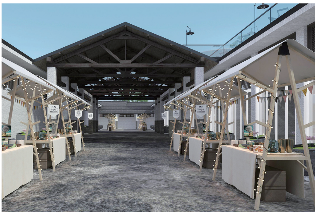
“西坞粮仓”个展室外部分、创意市场效果图

本报讯(通讯员 陈银儿 沈凯波)2月28日,西坞街道粮仓改造项目正式动工,街道将以旧粮仓为载体,打造新时代文明实践所成果展厅、西坞非遗文化体验与展示区、露天观光公园等区域,让传统建筑焕发新的活力。