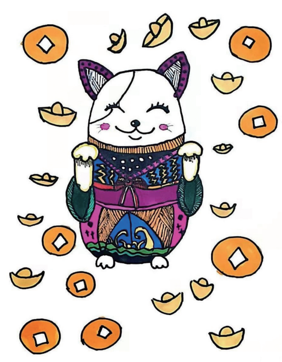
招财 202班小记者 王心忆 指导老师 孙慧俊