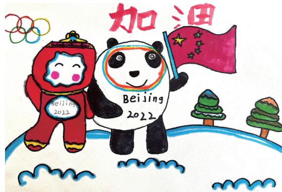
冰墩墩和雪容融 204班小记者 吴语熙