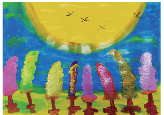
枫林月色 103班小记者 陆雨宸