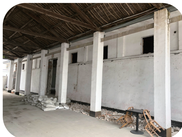
西坞粮仓微改造前