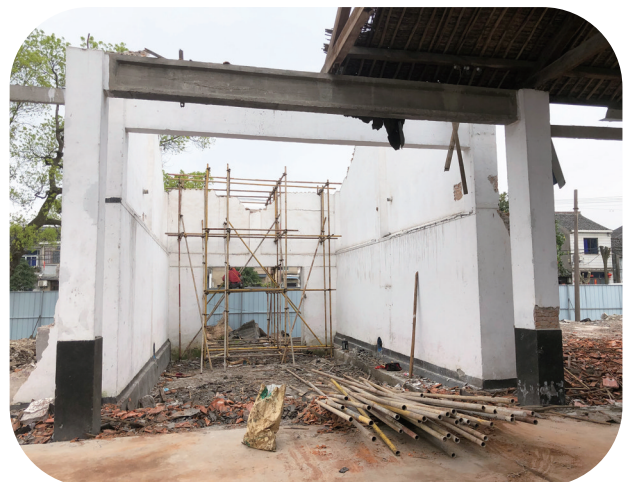
西坞粮仓微改造前