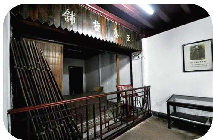
玉泰盐铺微改造前

此外,除了为游客打造更精致的游览体验,溪口景区还提升改造景区游客中心,不仅全面升级购票大厅,还改善了多处可供游客休息、咨询的场所,增加了咖啡吧、文创产品等休闲业态。