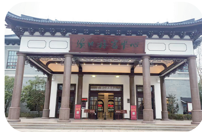
游客中心微改造后