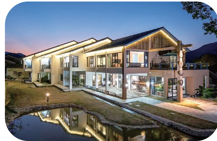
连山非宿微改造后