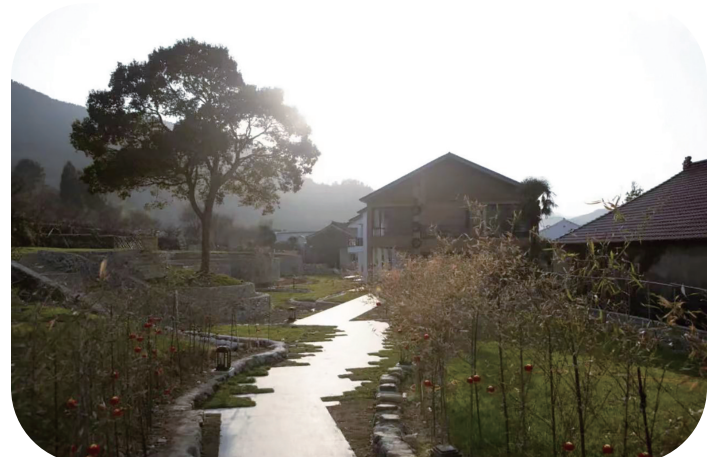
连山非宿微改造前

从小切口出发,精准把握旧有建筑的发展潜力,“微改造、精提升”专项工作延展了西坞粮仓的时代深度,以西坞文化了解地、高雅艺术享受地、休闲旅游观光地与“双中心”实践探索地作为粮仓的整体定位与发展目标,使其成为一个既融合党群服务中心、新时代文明实践所等社会功能,又符合当代文化和旅游需求,同步接轨市场的文化和旅游综合体。