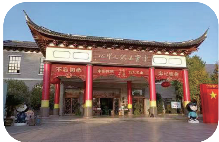
游客中心微改造前