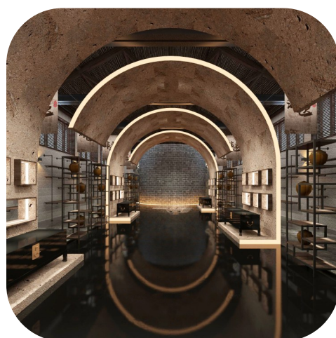
西坞粮仓微改造后