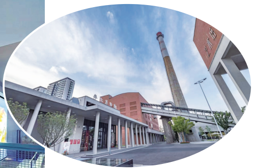
▲博物馆外景 ▲博物馆展厅