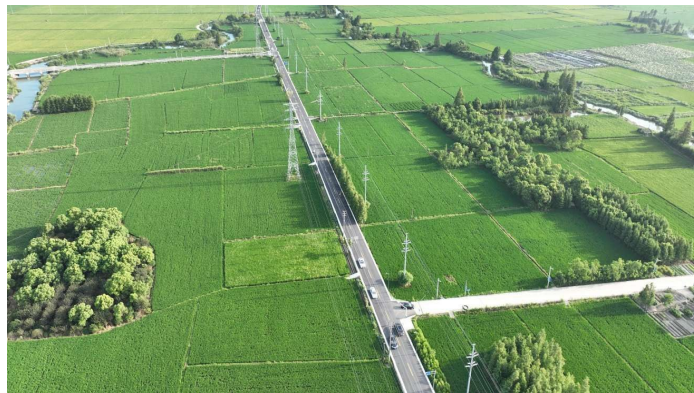
笔峰路(西坞—山下地)路面提升改造完成,解决了沿线村民的出行问题,有效提高了村民的生活水平和质量。