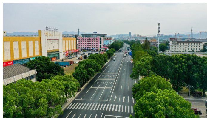
改造后的S214甬临线奉化段出行状况大大改善,通行能力提升。