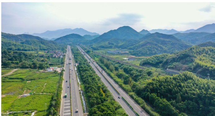
G228丹东线奉化段建设改造完成后,将进一步提升我区通行压力,改善周边群众出行条件。