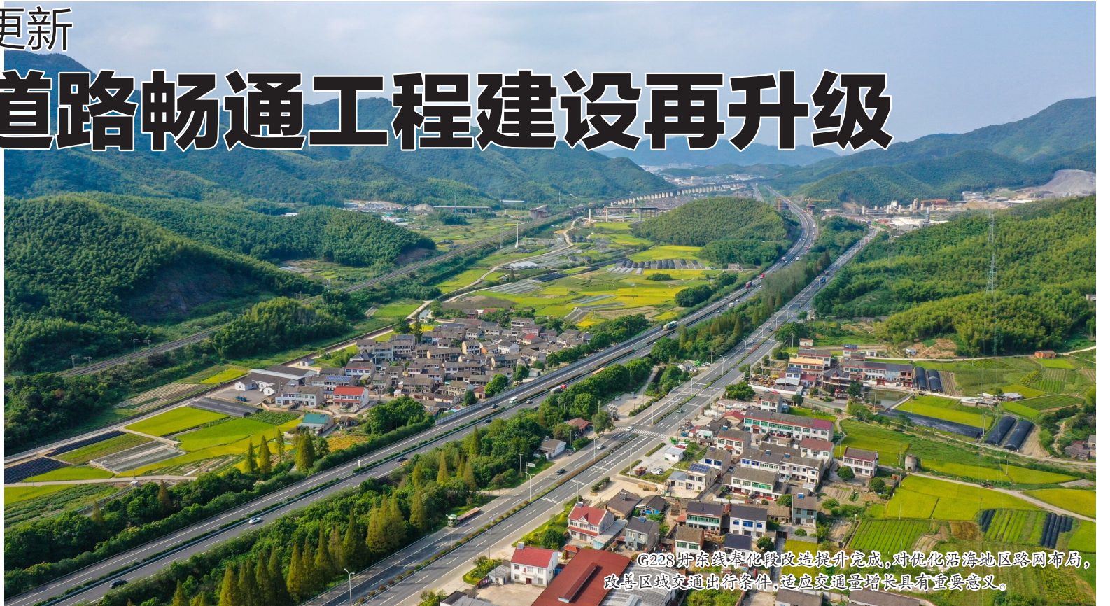
G228丹东线奉化段改造提升完成,对优化沿海地区路网布局,改善区域交通出行条件,适应交通量增长具有重要意义。

交通项目既是重大发展项目,也是民生项目,是提升城市品质、加速融入主城区的重要一环。为加快推动奉化综合立体交通发展,区交通运输局紧紧围绕中心工作,研究道路前期谋划、督促开工项目做实做细,全力推动2022年4项民生实事道路畅通工程。S214甬临线奉化段道路通行能力再提升,G228丹东线奉化段扮靓城市颜值,2条县道、7条农村公路相继迎来升级改造,全区各施工单位开足马力投入项目建设,打造通达便民交通路网,让居民收获更直接、更实在的获得感幸福感安全感。