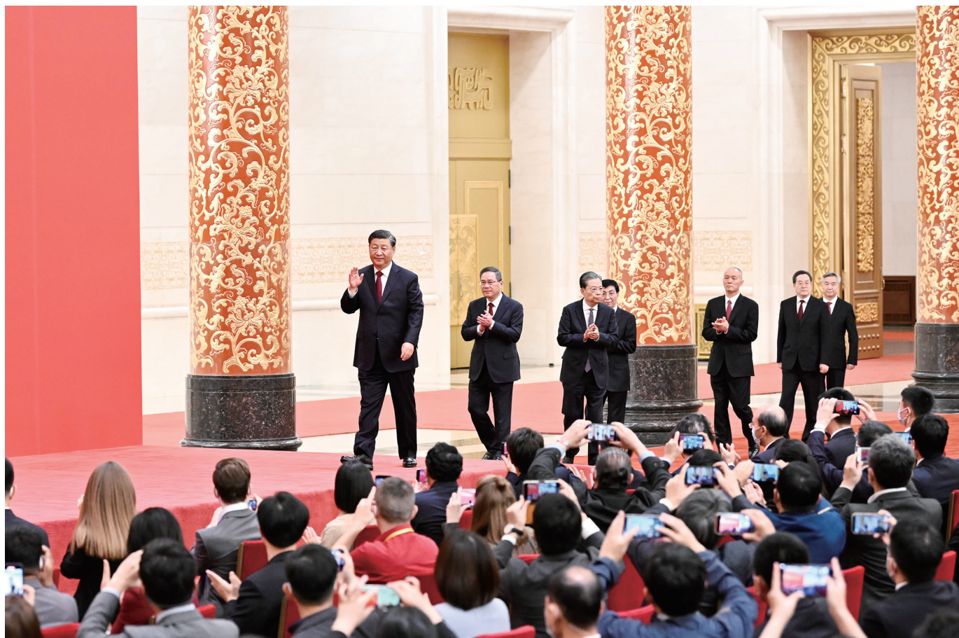
10月23日,刚刚在中国共产党第二十届中央委员会第一次全体会议上当选的中共中央总书记习近平和中共中央政治局常委李强、赵乐际、王沪宁、蔡奇、丁薛祥、李希在北京人民大会堂同采访中共二十大的中外记者亲切见面。这是习近平发表重要讲话。