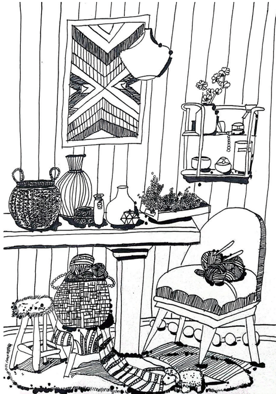
温馨一角 岳林中心小学505班小记者 葛曼琴