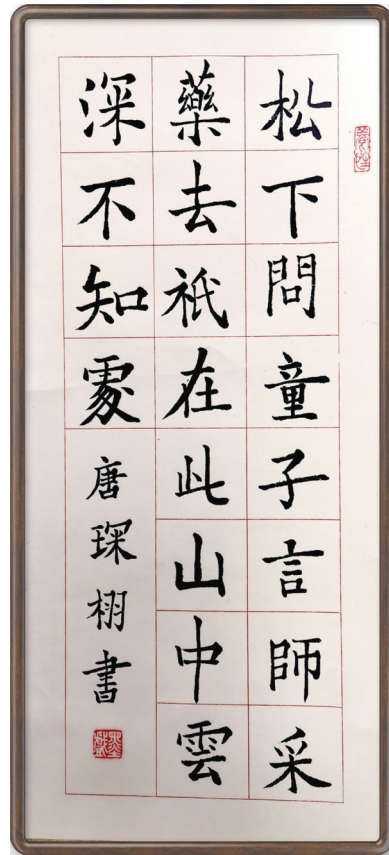
寻隐者不遇 武岭小学304班小记者 唐琛栩