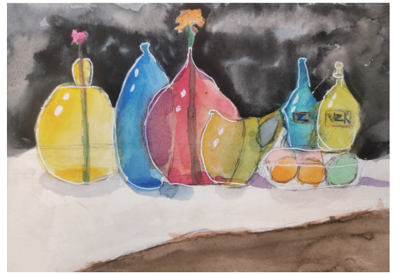
五彩花瓶 实验小学307班小记者 琚博添