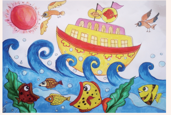
乘风破浪 203班小记者 郑嘉俊