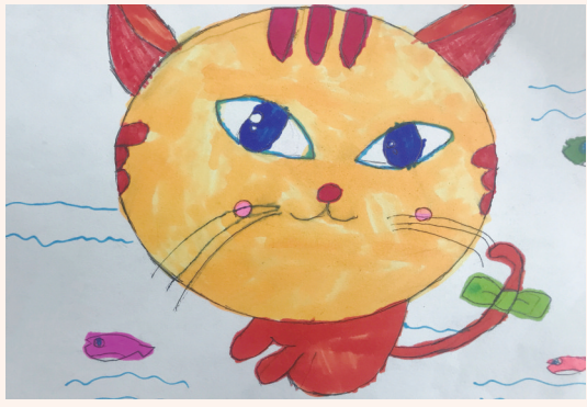
可爱的猫 202班小记者 李欣怡