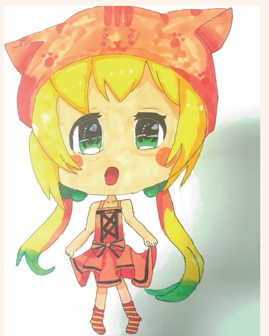
我的好朋友 302班小记者 葛格