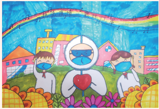
全民抗疫 203班小记者 赵芷璇