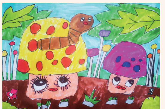
蘑菇的幻想 203班小记者 樊原宏