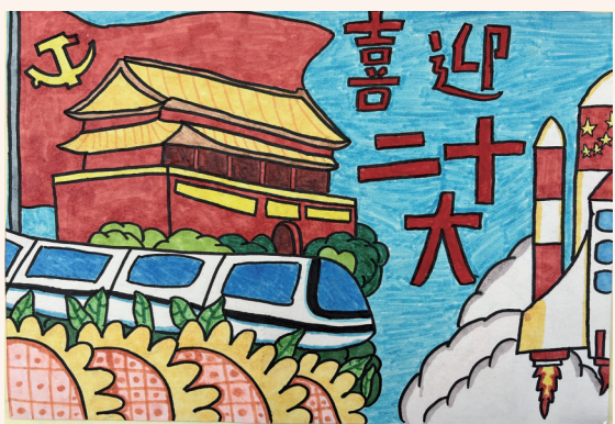
喜迎二十大 501班小记者 安佳倩 指导老师 张红