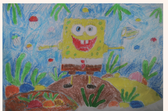
海绵宝宝的快乐 203班小记者 邓子豪