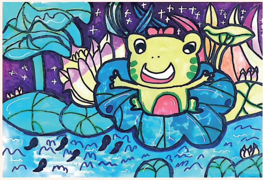
青蛙王子 301班小记者 仇昕乐