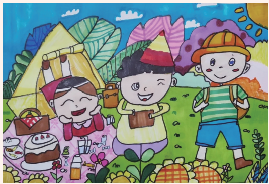
我们去野餐 302班小记者 沈方晔