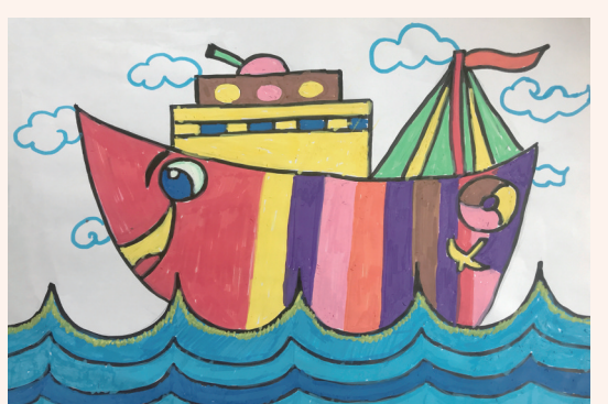
乘风破浪 202班小记者 何煜煜