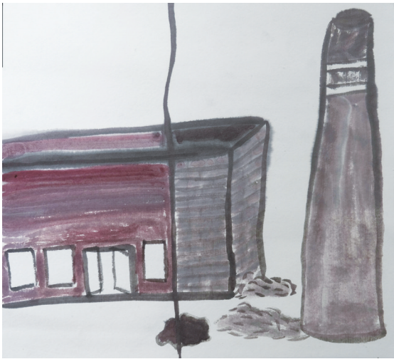
龙津实验学校 501 班小记者 何奕诚