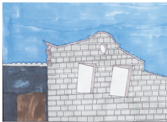
龙津实验学校 501 班小记者 周王诺