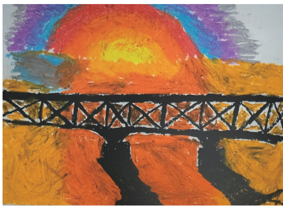
龙津实验学校 502 班小记者 葛佳涛