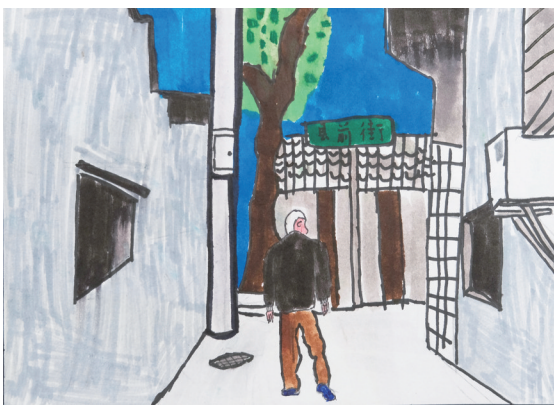
龙津实验学校 504 班小记者 石子轩