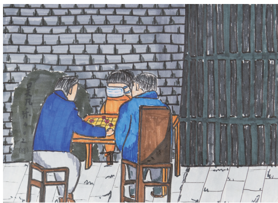
龙津实验学校 502 班小记者 吴凡乐