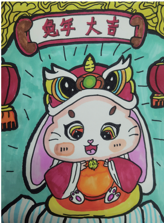
兔年大吉 实验小学501班小记者 袁梓涵