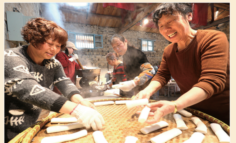
◆晾年糕 毛节常 摄