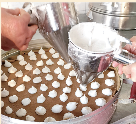
◆米馒头制作