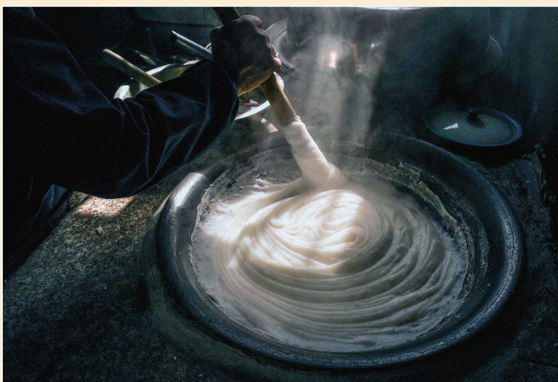
◆米豆腐制作