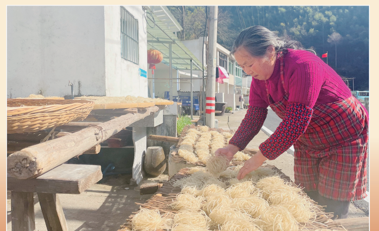
◆晒番薯粉