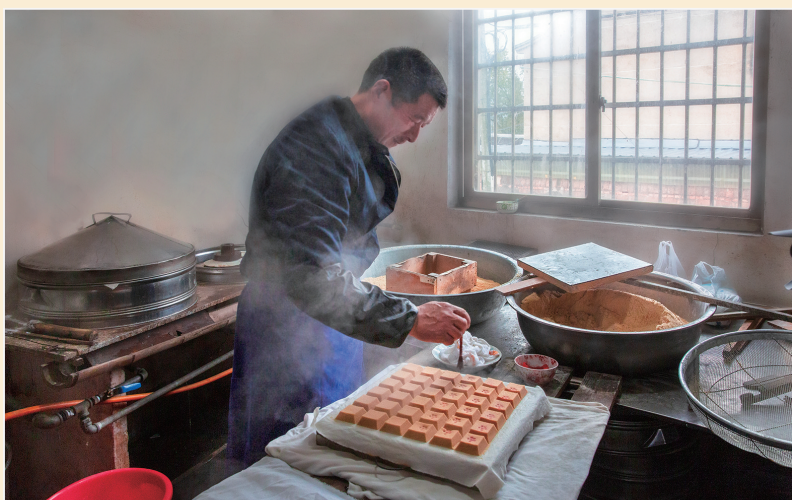
◆耐糕制作