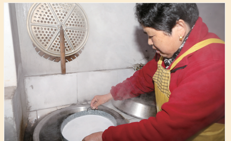
◆铜盆面制作