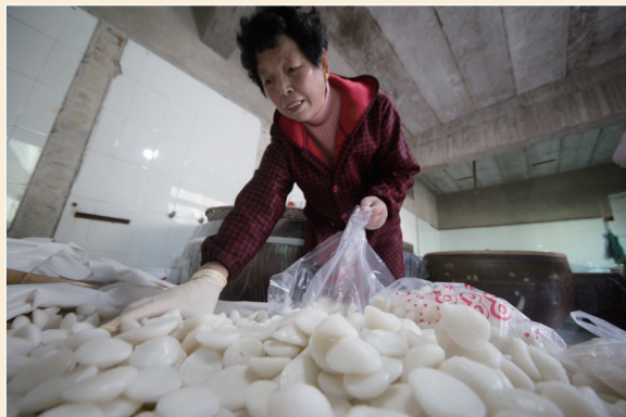
◆米馒头出炉