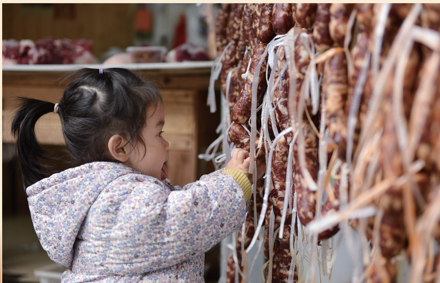
◆妈妈的腊肠