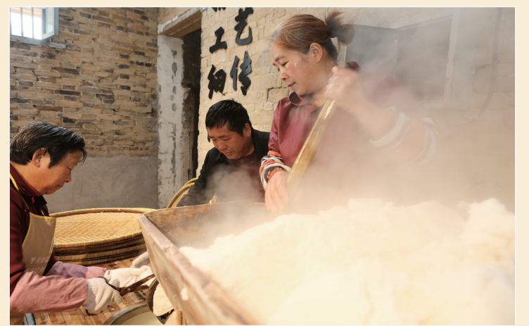
◆年糕制作