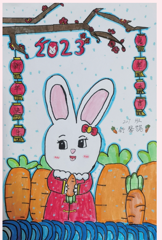
兔子爱萝卜 实验小学207班小记者 舒馨诺