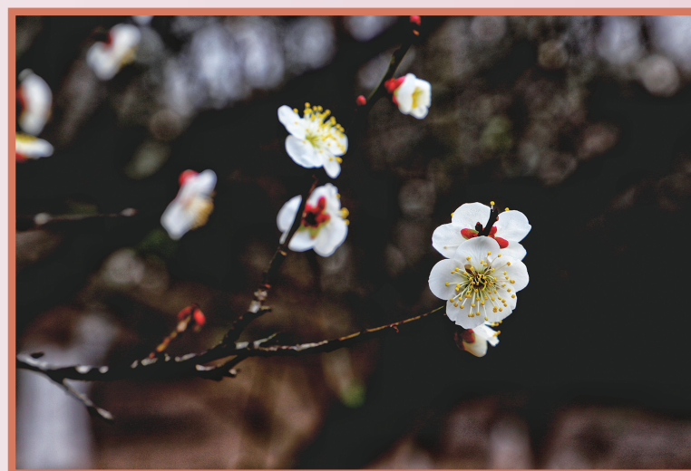
忽然一夜清香发 金寒昌