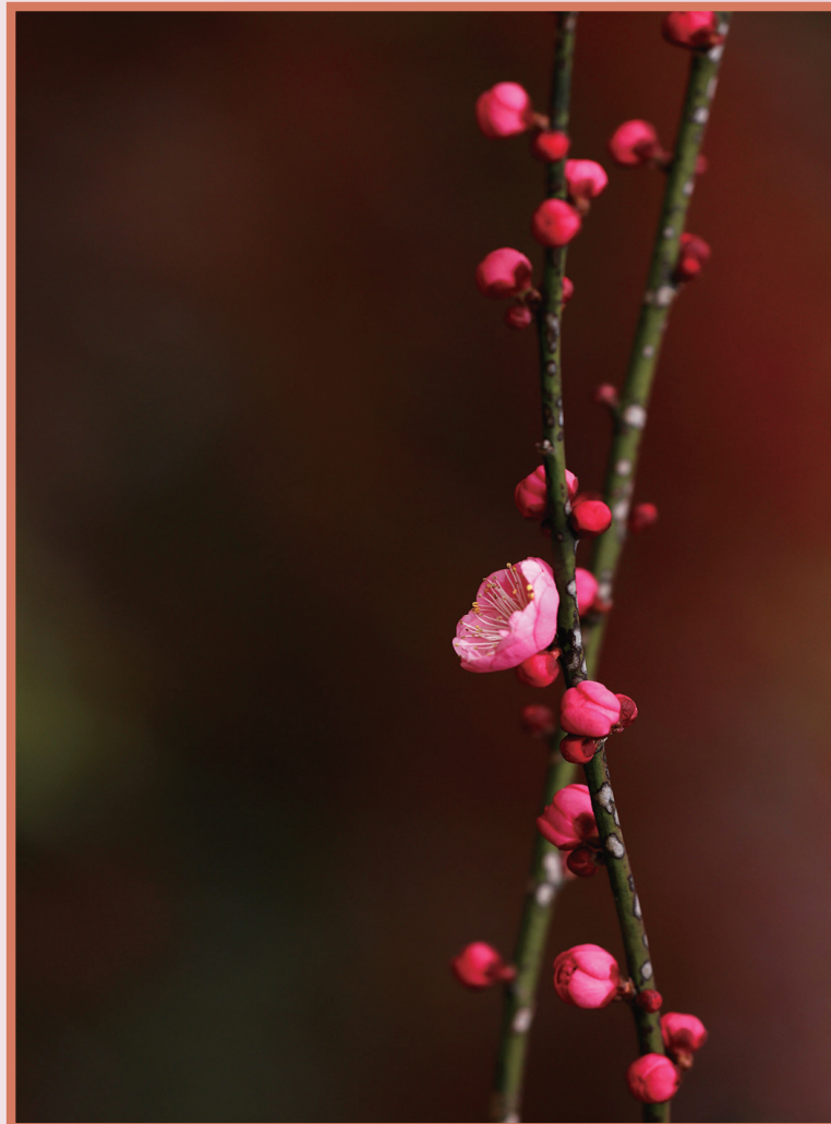
花吐胭脂 老人与海