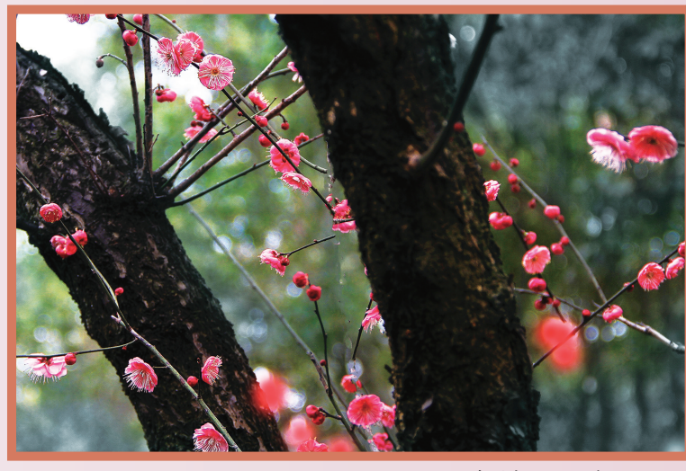
老树发嫩枝 高大庆