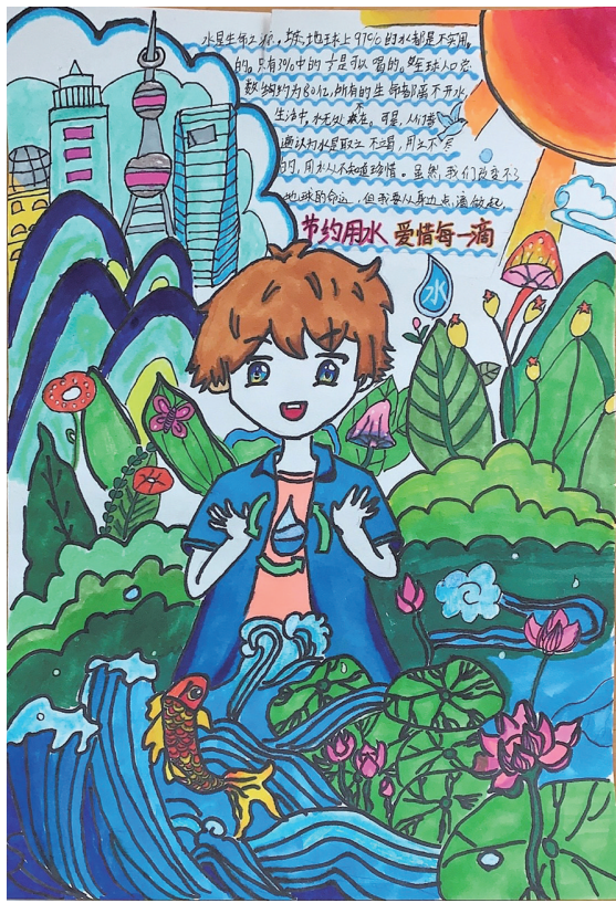
节约用水 爱惜每一滴水 502班小记者 沈威宏