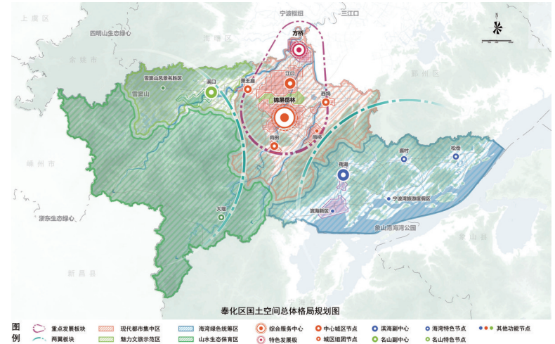
国土空间总体规划格局图

化空间格局,打造上海大都市圈创新飞地;推动甬金发展廊道建设,打造奉化外向型经济先行区;支撑建设甬绍一体化奉化先行区;促进与海曙、鄞州、宁海、象山等地协同保护与利用山海资源。