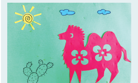
沙漠之舟 萧王庙中心小学202班小记者 李欣怡