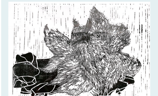
山海经里的九尾狐 实验小学405班小记者 张徐瑾 指导老师 罗青青