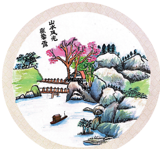
山水风光 居敬小学407班小记者 张黎露

听说动物园里的动物高大威猛,我便去看看,动物园里有什么动物?从门口进入,向前走大约500米就可以看到一张超大的地图,往左走一点,可以见到一个指路牌,上面写着“前方蛇馆”和“右方狮园”八个大字。进入蛇馆,你会见到几根树枝和几块大石头,仔细看,会发现一条比手臂还粗几倍的蛇正躲在石头旁。有的蛇身材细小,就像一根树枝,有的蛇身材粗壮,就像一棵大树,有的蛇体型中等,身上的花纹五颜六色。出了蛇馆,就去狮园看看。走入后,会发现有一个大坑,坑里有几只狮子,狮子见我们会引吭大叫,像是在警告入侵者离开。我们走到一旁,它便跳上假山,静静地盯着我们,散发出一种威风凛凛的感觉。如果你在狮园里又蹦又跳,它便会厉声叫嚣,好像下一秒你就会被他撕碎,它还会举起利爪,凶猛地看向你。动物园到处有好玩的动物,说也说不尽。