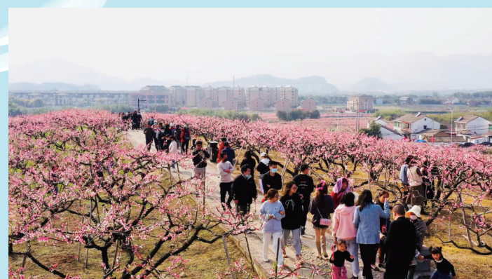
各地游客来奉赏桃花