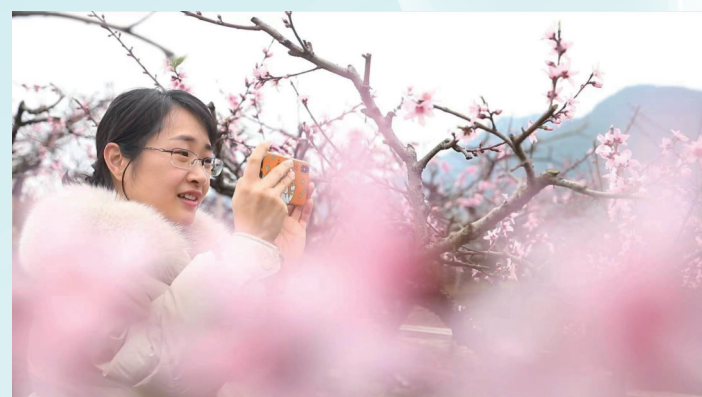
游客拍照定格花开瞬间

食物是神奇的东西,连接着人与家乡的情感,一旦你生于斯长于斯,味蕾便注定被圈定在家乡的半径之内,这种味道,不仅深入记忆,更会刻入骨髓。当甘甜的汁水在口腔内开始“奏乐”,这一刻,家乡就在身边,回忆奔涌而来。