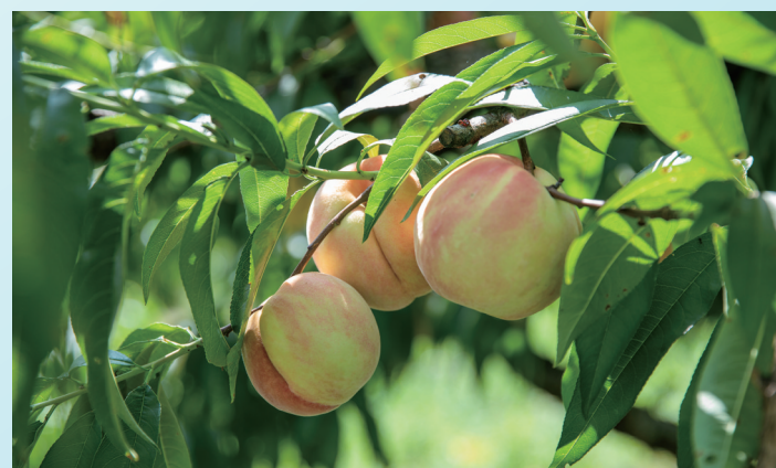
奉化水蜜桃主栽品种