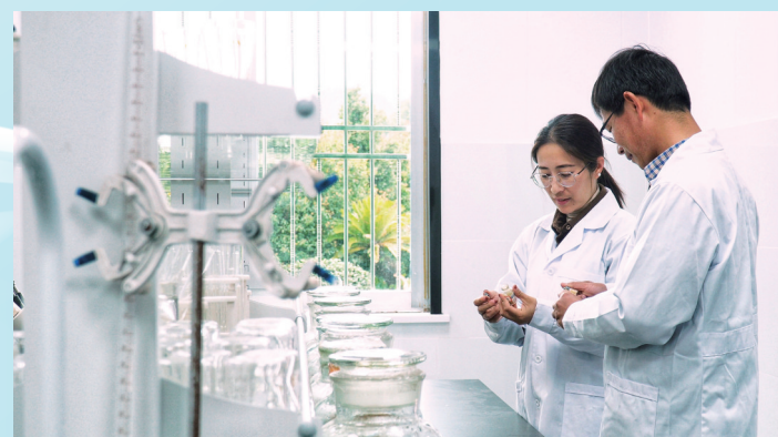
农技专家开展水蜜桃新品种选育