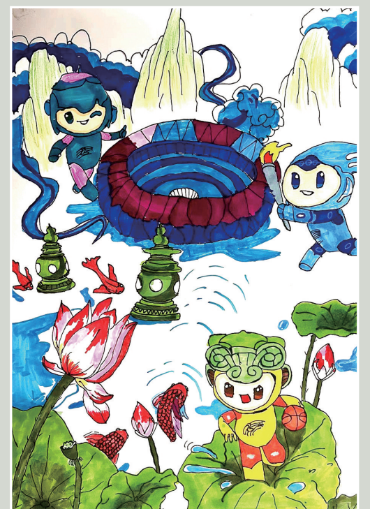
迎亚运 尚田中心小学503班小记者 张雨璐