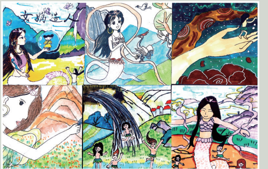
女娲造人 岳林中心小学203班小记者 方一舟