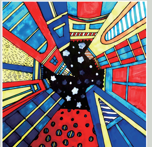
仰视建筑 实验小学107班小记者 张芷晗