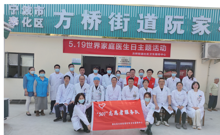
5·19世界家庭医生日主题活动

特色服务普惠化。2023年4月,我区结合省肿瘤医院优势力量,在全省率先开展由政府主导的大规模消化道肿瘤筛查,将该项目列入区民生实事。项目投入3000余万元,覆盖40至74岁约27万奉化户籍人群,所有筛查对象免费检测幽门螺旋杆菌和便潜血定量试验,高危人群免费开展内镜检查。截至7月31日,全区已筛查3.2万人,查出患者49人、癌前病变57人。