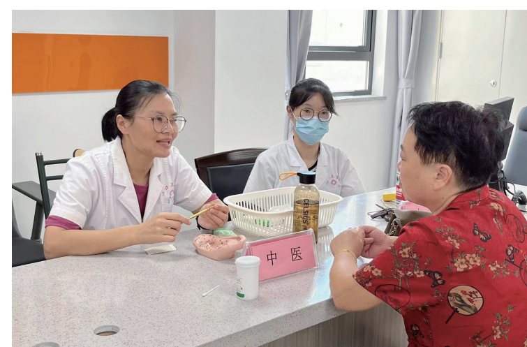
“服务百姓健康行动”义诊活动