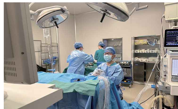
首例全听骨植入术