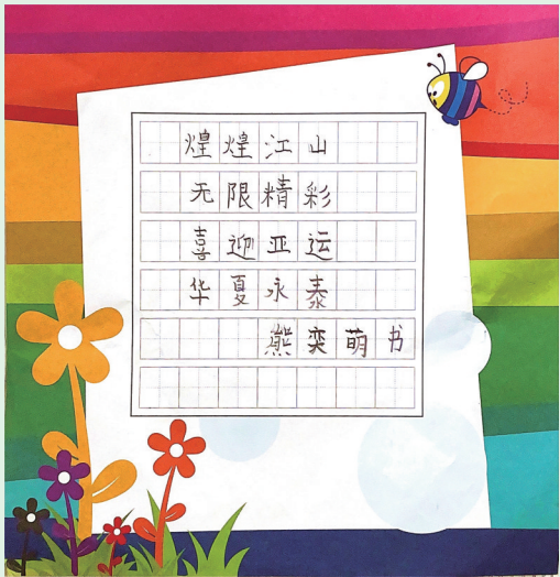
书法作品 班溪小学202班小记者 熊奕萌