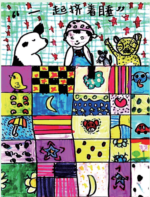
一起挤着睡 班溪小学301班小记者 谭凌薇