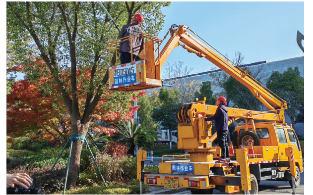
区园林处修剪遮挡视线的树枝

照明设施亮起来。区综合执法局动员众多力量,逐一检测所辖区内15878盏路灯、307104套景观灯以及配套设施的安全性能,更换了166盏路灯。修复了公园设施廊架、坐凳、儿童游乐设施等存在安全隐患问题80余处,修剪树枝隐患47处。之前黑灯、照度低的点位均不复存在,有效缓解了“灯下黑”和“树挡灯”顽疾。