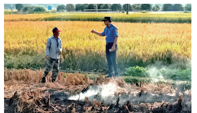
在秸秆焚烧现场开展宣教工作