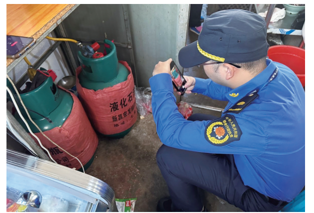
餐饮店瓶装燃气安全检查

“温馨提示:为了您和家庭安全,请正确使用燃气。请检查连接管是否存在脱落、松动、破损、老化、龟裂等情况……”这是一条燃气安全提示短信。区综合行政执法队所属各中队通过多渠道、多角度全年开展燃气领域安全宣传,通过发动镇街消防、社区网格员、宣传志愿者等群体,利用显示屏、短信等载体推送燃气安全常识,开展针对性、提示性、引导性的燃气安全宣传,大力普及燃气消防安全常识和逃生自救知识,不断提升群众安全用气意识。