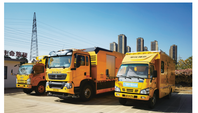
区排水处强排车辆