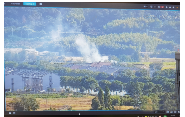
运用大数据实现秸秆焚烧智能巡查

疏堵结合,织密秸秆禁烧网。强化“人防+技防”支撑,各属地中队从单纯依靠执法队员车巡转变为同时运用大数据以及高空瞭望系统进行智能巡查,第一时间对秸秆焚烧行为作出执法响应。增强应急处置能力,各属地中队通过配备洒水壶、水桶、铁锹等基础灭火设备,提升现场处置效率。针对我区焚烧的违法主体多为年纪大、法律意识薄弱的农户,焚烧物又多为零星农作物、草木灰堆等,存在规模小、点位多、危害程度较小的特点,区综合执法局采取以“教育为主、处罚为辅”的手段,确保将危害消除在萌芽阶段。截至目前,现场教育劝导处置600余起。