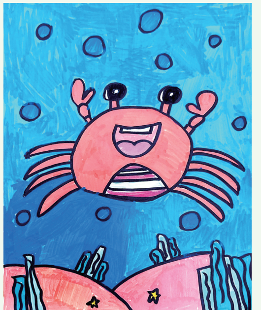
螃蟹 班溪小学201班小记者 谭江林