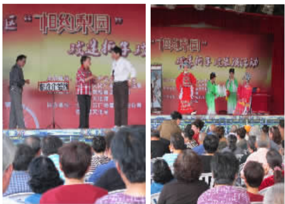
图为演出现场。

此次戏迷折子戏展演,为广大的戏迷团体和戏曲爱好者提供了一个展示自我的平台,参赛团队和演员都希望以后能够有更多这样的机会让大家来尽情展示。(曹雯雯)