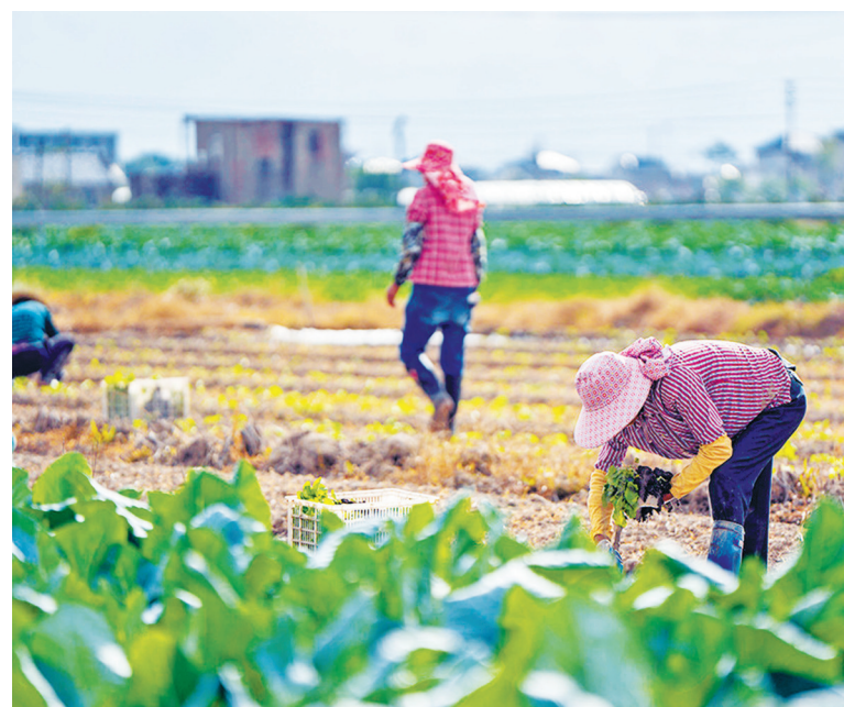
村民在收割后的水稻田里种植蔬菜。

本报讯(见习记者何晴 通讯员吴敏勇 章铭书)整地、起垄、栽苗浇水……随着秋收陆续结束，象山县定塘镇金牛港村的村民在收割后的水稻田里，搞起了“稻菜轮作”。