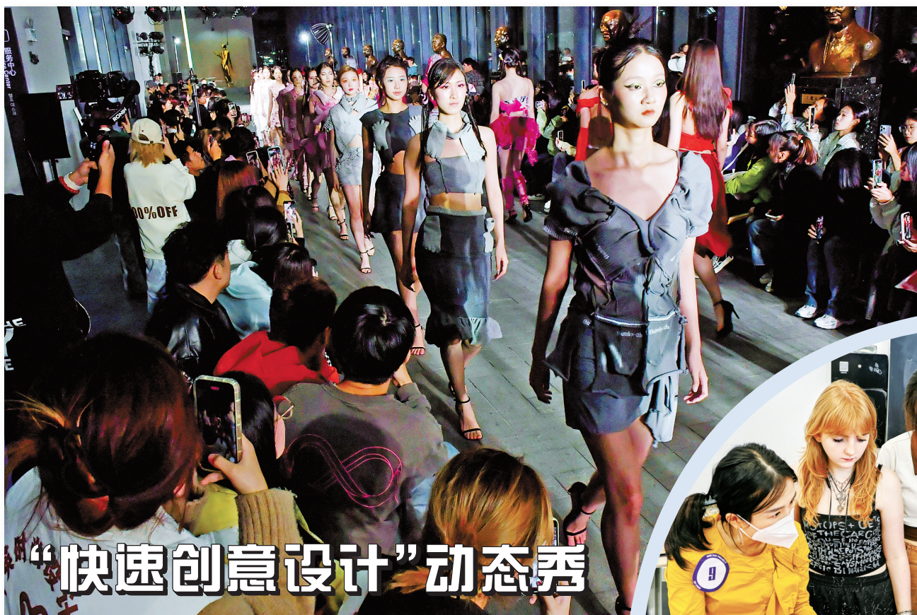
“快速创意设计”动态秀现场。

“接下来，我们将以此次专项整治为抓手，将监督贯穿其中，着力提升监督质效，切实解决工作中的堵点、难点，进一步巩固老旧小区改造成果。”北仑区纪委监委相关负责人说。