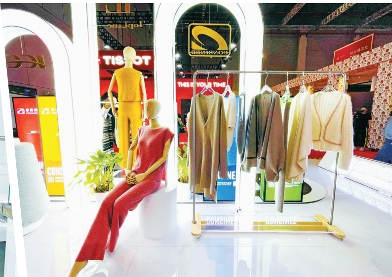
康赛妮展位的羊绒衫。