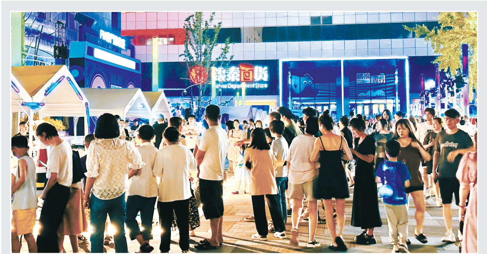
市集的平价商品吸引了年轻消费者。