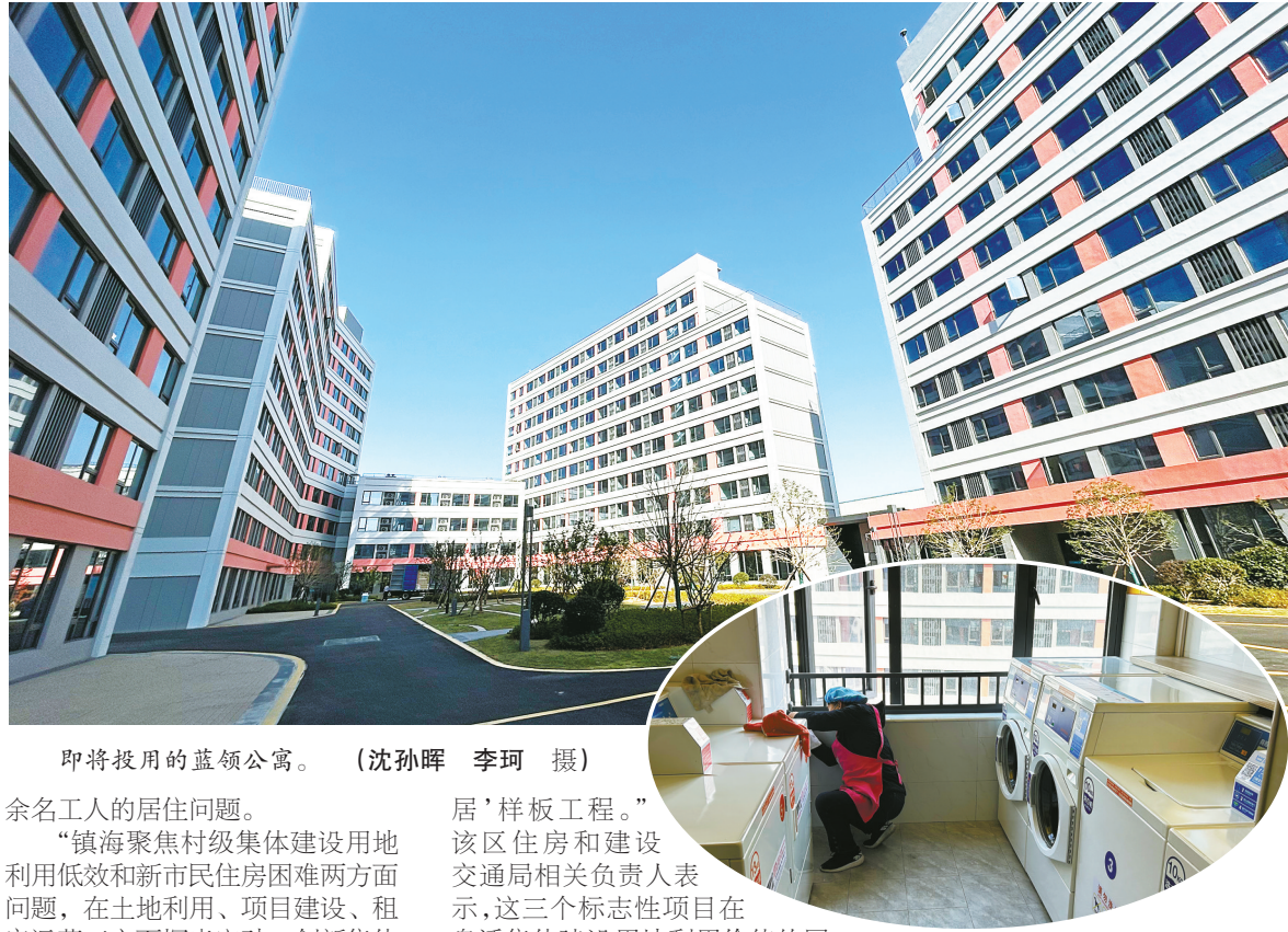
即将投用的蓝领公寓。

“永旺村青创公寓以引进人才为主,庙戴村庙戴公寓以解决周边产业工人居住需求为主,而迎周村的保租房主要面向区内企业在职工工定向租赁。”项目负责人钟炎表示,保租房干净整洁,公共设施完善,可以拎包入住,能解决2000