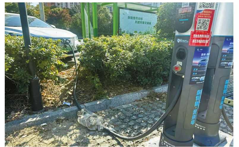
充电桩电线被拖过绿化带充电。