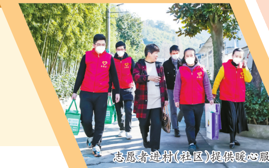
志愿者进村(社区)提供暖心服务。