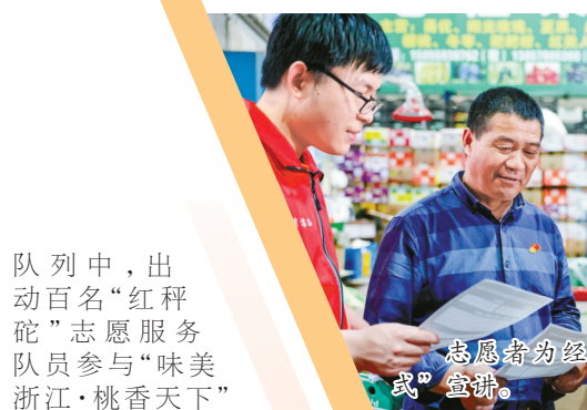
志愿者为经营户进行“点单式”宣讲。