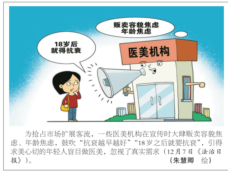
为抢占市场扩展客流，一些医美机构在宣传时大肆贩卖容貌焦虑、年龄焦虑，鼓吹“抗衰老越早越好”“18岁之后就要抗衰老”，引得求美心切的年轻人盲目做医美，忽视了真实需求（12月7日《法治日报》）。朱慧卿 绘

对此，执法部门必须加强监管，让偷偷亮起的“生鲜灯”无可遁形。对违反禁令被警告的商户，应该随时跟踪其整改情况，对拒不整改的，依法作出进一步处理。只有违法一家查处一家，令违法者得不偿失，才能将“生鲜灯”禁令落到实处。