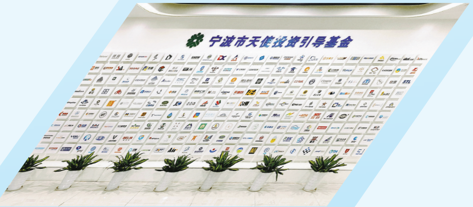
市天使投资引导基金投资的部分企业

对初创跟投，宁波不仅支持力度更大，还可形成整体效应：“初创跟投业务模式还将联动种子直投项目，优先中取优，多轮投资加持，强化对专业投资机构的吸引力，进一步提升对科技型初创企业的跟进投资覆盖面。”市天使投资引导基金管理团队负责人说。