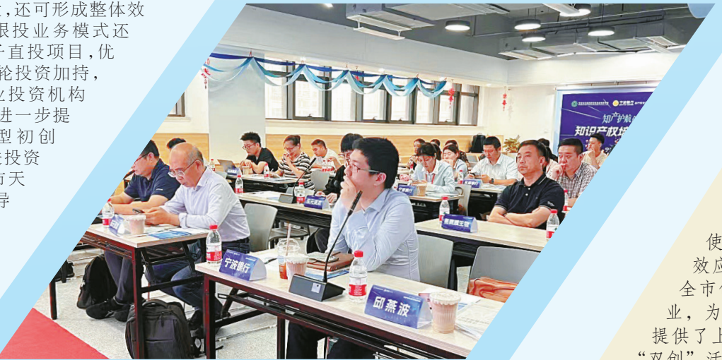
“数字工业，智转未来”天使链接活动现场