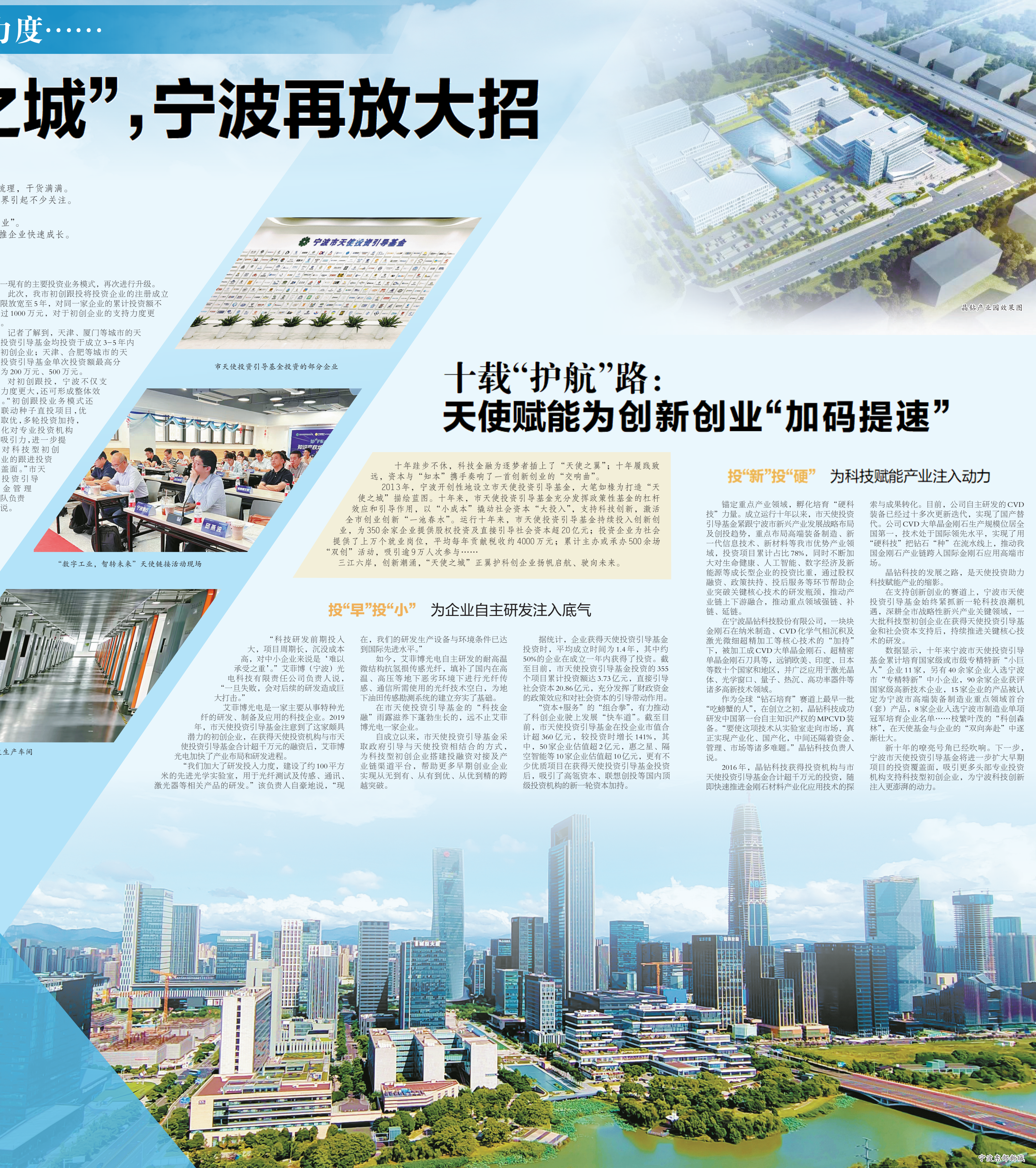
晶钻产业园效果图

新十年的嘹亮号角已经吹响。下一步，宁波市天使投资引导基金将进一步扩大早期项目的投资覆盖面，吸引更多头部专业投资机构支持科技型初创企业，为宁波科技创新注入更澎湃的动力。