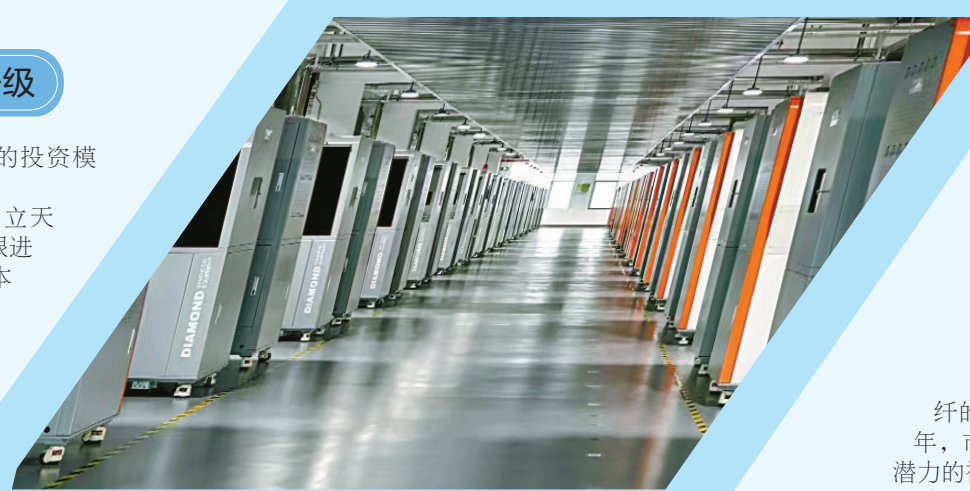
晶科科技生产车间