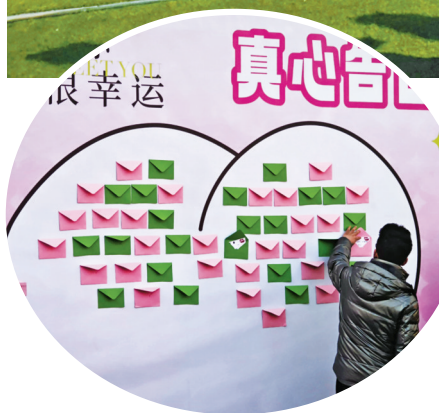
▲心愿墙前,一男士将自己的“心动卡片”放入信封中。