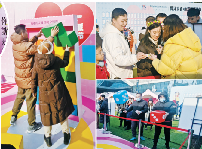
►现场男女互动游戏。

如何注册成为会员?打开甬派APP,从底部“服务”板块进入“甬派交友”平台,免费注册