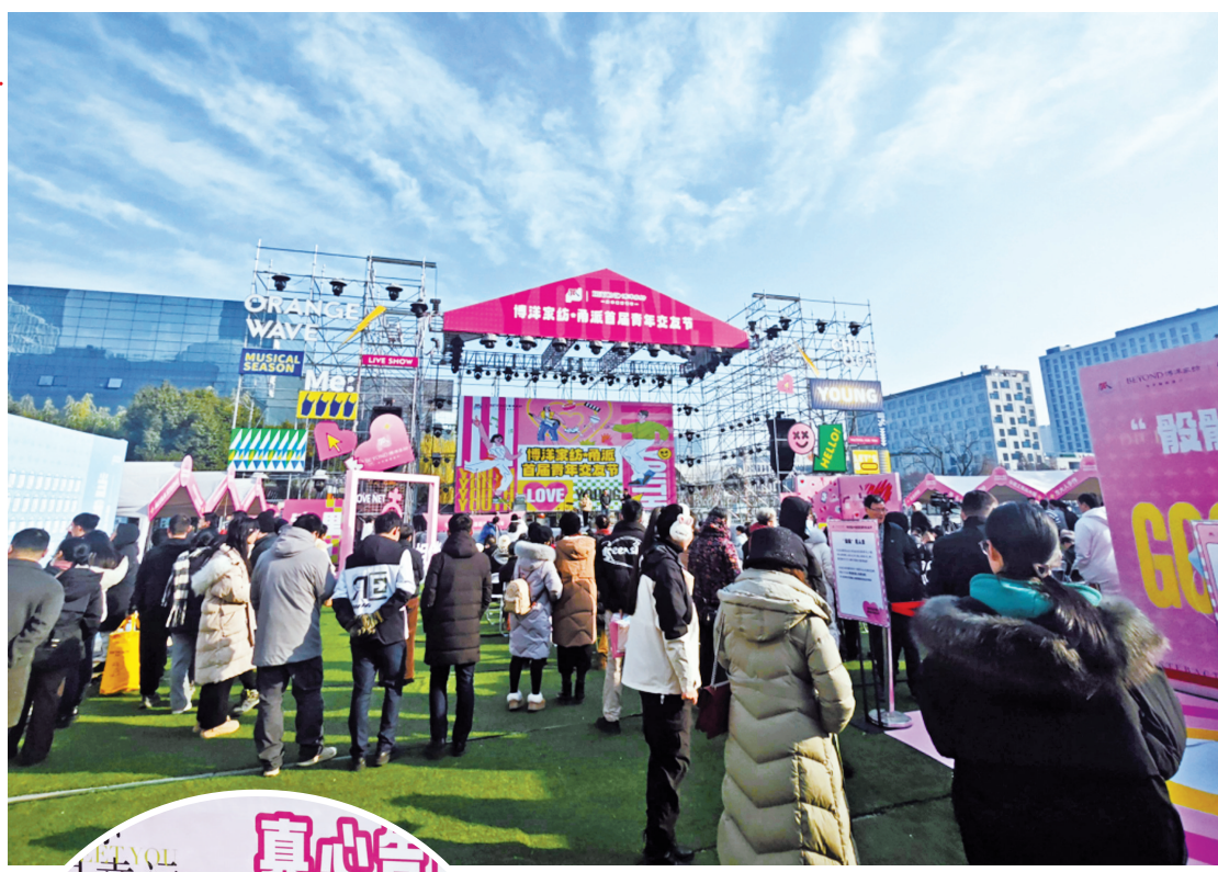
周日的交友节依然热闹。