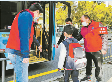
“五老”护苗队守护孩子的上学路。

年邮政快递业积极服务乡村振兴战略，加快健全县乡村寄递服务网络，启动农村寄递物流体系建设三年行动，实施“一村一站”工程，