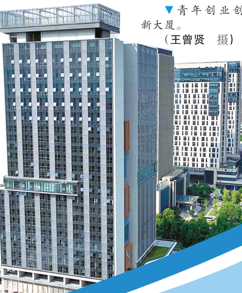
青年创业创新大厦。

生态文明建设，未有穷期。北仑将始终笃定践行“两山”理念，奋力打造生态文明高地和美丽中国县域标杆，以北仑环保的生动实践，书写中国式现代化港城示范区的绿色华章。