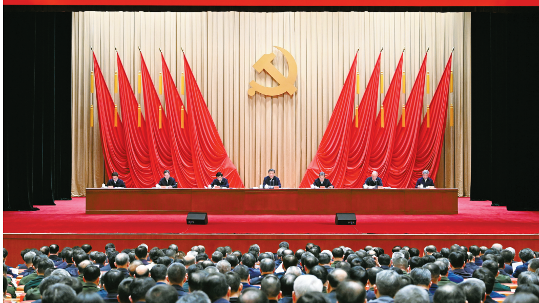
中共中央总书记、国家主席、中央军委主席习近平在开班式上发表重要讲话。赵乐际、王沪宁、蔡奇、丁薛祥、李希、韩正出席开班式。