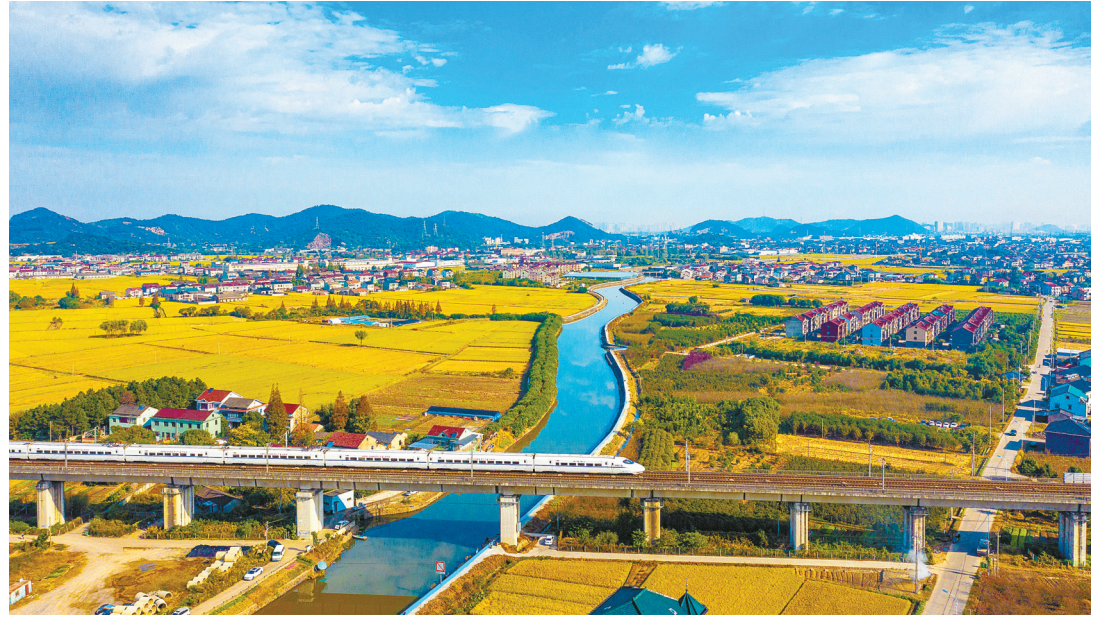
高铁驶过美丽乡村。

锚定目标、接续奋斗,敢作善为、勇毅前行。今年,慈溪将统筹推进三个“一号工程”,大力实施“十项重大工程”,改革创新再深化,攻坚突破攀新高,巩固和增强经济运行持续回升向好态势,努力实现质的有效提升和量的合理增长,奋力争当中国式现代化示范引领的县市域实践“排头兵”,以慈溪的“稳”“进”“立”为全国全省宁波大局多作贡献。