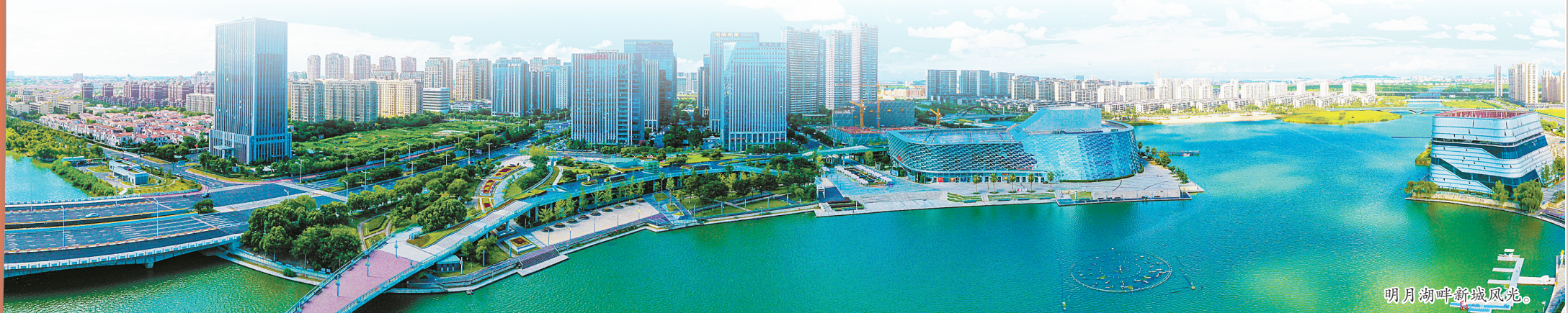
明月湖畔新城风光。