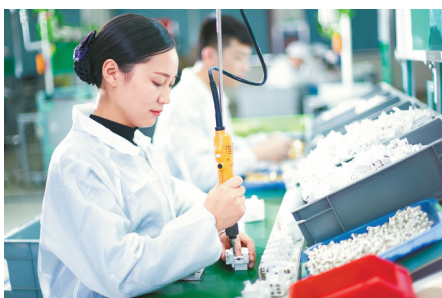
公牛装饰开关生产线。